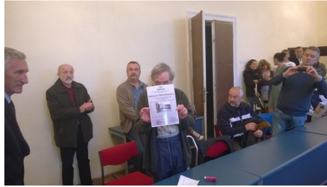
Momenti dell' incontro con il Presidente del Sindacato Zastava

Strette di mano, abbracci e sospiri di speranza affinché il sindacato ritorni alla sua primordiale funzione di rappresentanza dei lavoratori e si parte per il quarto impegno della giornata, la visita presso la scuola di umi dove le associazioni di Brescia e Trieste hanno sistemato le aule di una sede distaccata dal corpo centrale del complesso scolastico.