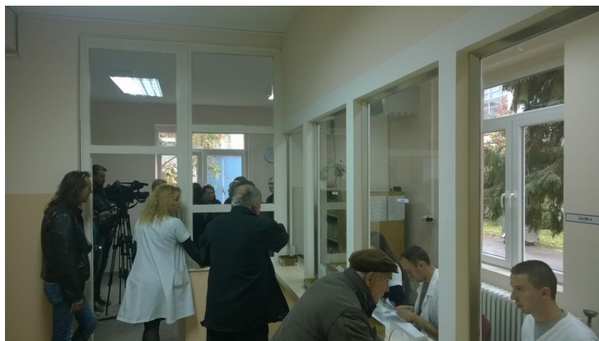
La sala di accettazione del Poliambulatorio Filip Kljajic

Il secondo impegno della giornata è alle 10.15 presso il poliambulatorio " Filip Kljajic " per la sua inaugurazione. Vedendone personalmente le condizioni l'anno scorso, rimango particolarmente colpita dal buon esito delle attività di ristrutturazione che ha reso del tutto confortevole l'ambiente e conforme alle attività che quotidianamente vengono svolte ( centro prelievi, sala dentistica, ambulatori visite poli specialistiche, ecc.) .