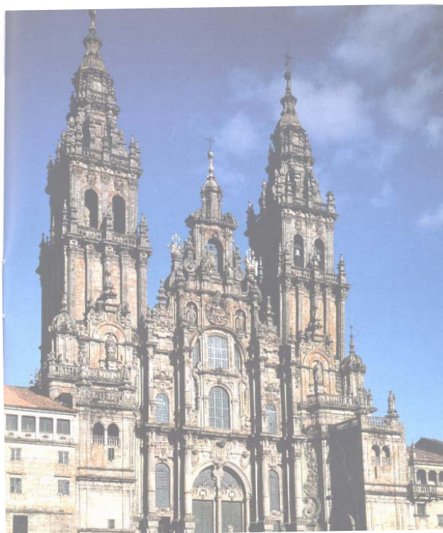
Santiago de Compostela - La Cattedrale