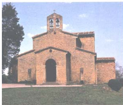
Oviedo - San Julián de los Prados

Pranzo in ristorante in corso d'escursione. Al termine partenza alla volta di Oviedo a circa 170 km.