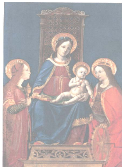
Bernardo Zenale - Madonna col Bambino

Dal martedì al venerdì: 10.00-13.00 e 15.00-18.00