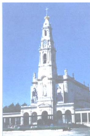
Il Santuario di Fatima

Prima colazione in albergo. Al mattino visita guidata della città.