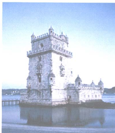
Lisbona - La Torre de Belém

Prima colazione in albergo. Mattinata libera dedicata a un poco di relax e shopping di souvenirs.