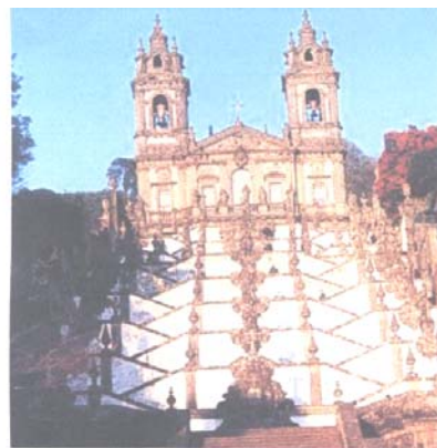
Braga - Santuario di Bom Jesus

Visita guidata al famoso Santuario di Bom Jesus . Pranzo in ristorante.