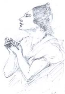
- G. Puccini - Tosca

L'invito è ovviamente rivolto a tutti, donne e uomini