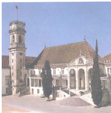
Coimbra - La Torre dell'Università

Pranzo in ristorante. Al termine della visita partenza per Fatima a circa 90 km. Sistemazione in hotel 4 stelle nelle camere riservate, cena e pernottamento.