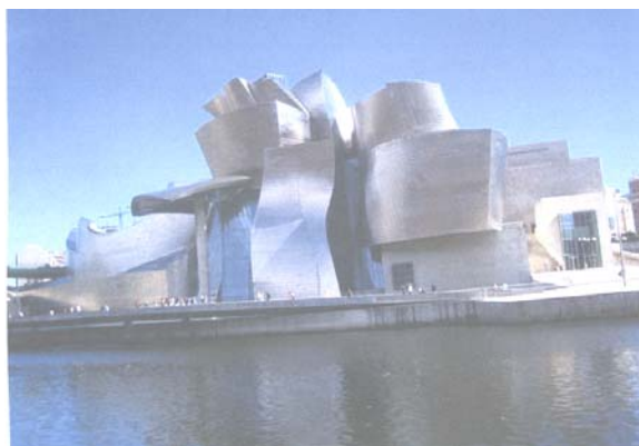
Bilbao - Museo Guggenheim

In serata rientro in albergo. Cena e pernottamento.