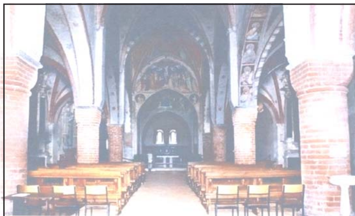
La navata centrale

Le prenotazioni saranno accolte presso l'Ufficio informazioni di Santa Maria Gualtieri a partire dalle ore 9,00 di martedì 19 ottobre.