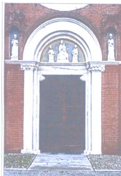
Il portale d'ingresso

Sulla parete che fronteggia questo dipinto è raffigurato il Giudizio Universale . Al centro, la figura del Cristo; alla sua destra i benedetti , con il volto proteso