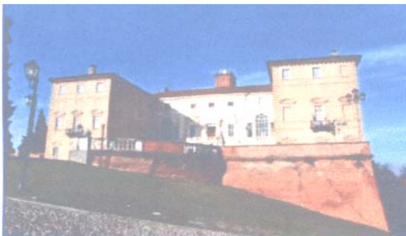
Il Castello di Govone