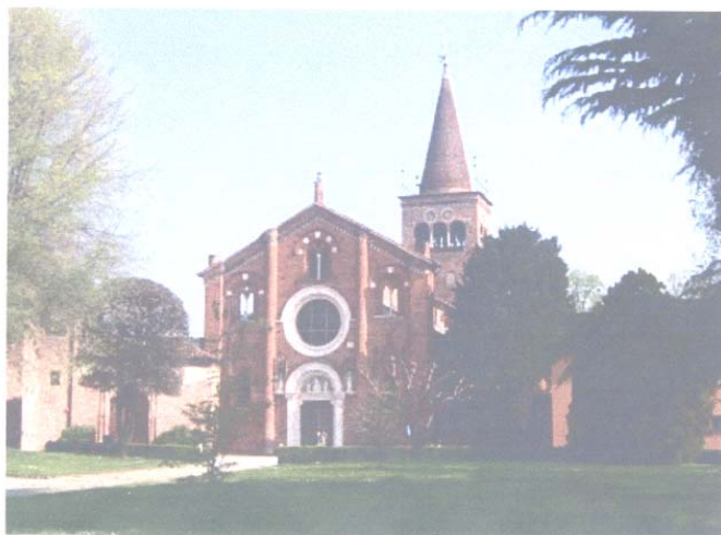
L'Abbazia di Viboldone