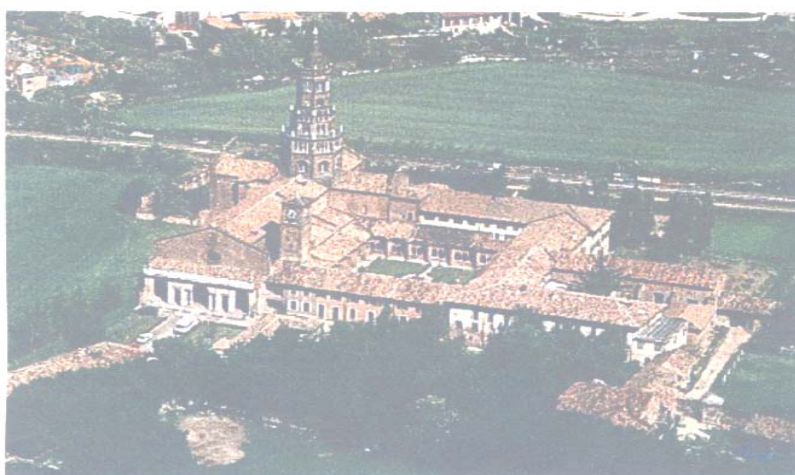
Veduta aerea del complesso monastico dell'Abbazia di Chiaravalle

Durante il Rinascimento molti pittori e artisti lavorarono all'abbazia; a questo periodo risalgono ad esempio le opere di Bernardino