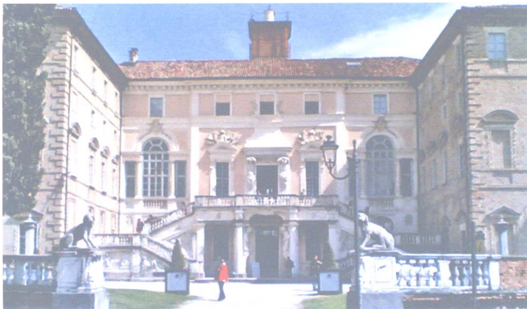
Il Castello di Govone