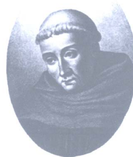
San Bernardo di Chiaravalle

ottenendo l'uso dell'Abbazia e delle terre a essa adiacenti per i successivi 29 anni, rinnovabili.