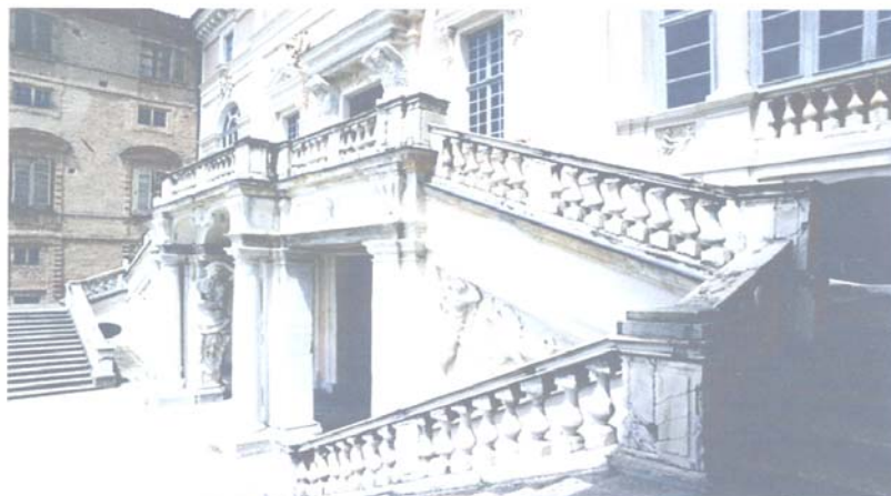
Castello di Govone - Il doppio scalone d'ingresso

Le prenotazioni saranno accolte presso l'Ufficio informazioni di Santa Maria Gualtieri a partire dalle ore 9,00 di lunedì 4 ottobre.