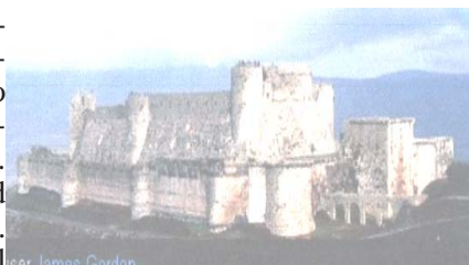
Krak des Chevaliers

Krak . Proseguimento per Palmyra . Check-in, cena e pernottamento all'hotel Zenobia Cham Palace o al Palmyra Oasis Boutique Hotel****.