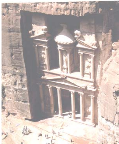
Petra - Il tesoro del faraone

tagliate direttamente nella roccia ne fanno un monumento unico, che è stato dichiarato Patrimonio dell'Umanità dall'UNESCO nel 1985. Nel 2007, inoltre, Petra è stata dichiarata una delle cosiddette sette meraviglie del mondo moderno . Pranzo al King's Castle Restau-