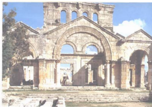
Aleppo -La basilica di S. Simeone

Prima colazione in hotel. Mattinata dedicata all'escursione alla basilica di San Simeone , il famoso monaco stilita che avrebbe trascorso 36 anni in cima a una colonna. Visita della basilica. Rientro ad Aleppo e visita della cittadella. Visita della Grande Moschea e del souk. Pranzo, durante le visite, al ristorante Zomorod . Visita del quartiere Jdeideh. In tardo pomeriggio rientro in hotel per la cena e il pernottamento.