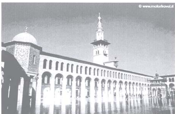
Damasco - La Moschea degli Omayyadi

Venerdì 7 maggio – DAMASCO Prima colazione in hotel. Intera giornata dedicata alla visita di Damasco , una delle città più antiche del mondo fra quelle tuttora abitate. La capitale siriana è oggi una metropoli ricca di contrasti, dove tradizioni e usanze antiche convivono con lo stile occidentale e la modernizzazione. A Damasco hanno lasciato il segno molte civiltà, soprattutto quella romano-bizantina e quella islamica. Nel 1979 il centro storico, cinto da mura di epoca romana, è stato dichiarato Patrimonio dell'Umanità dall'UNESCO. Visiteremo il Museo Nazionale, il souk, la città vecchia, il Mausoleo di Saladino, il Palazzo di Azem e la Moschea degli Omayyadi dove sono conservate le reliquie di Giovanni Battista, considerate sacre sia dagli abitanti del posto, in gran parte sunniti, sia dalla minoranza sciita, sia dai cristiani. Pranzo in ristorante tipico durante le visite. Passeggiata lungo la Via Recta , dove è sempre presente l'ombra di San Paolo. Visita della chiesa di San Paolo e Hanania. Cena e pernottamento in hotel.