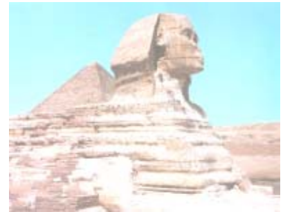
La sfinge di Giza