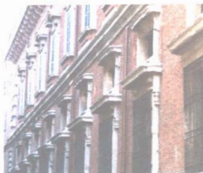
Milano - Il palazzo della Pinacoteca di Brera

Il costo è di Euro 25,00 comprensivo del viaggio in pullman, biglietto d'entrata e guida.