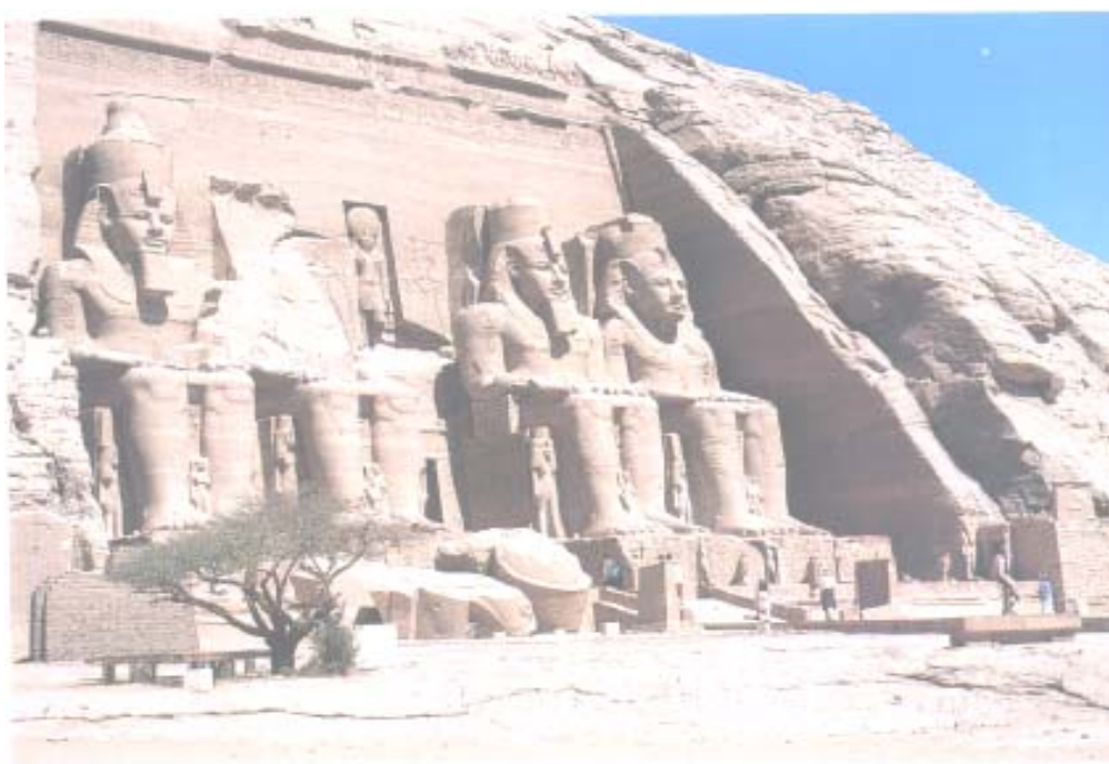
Abu Simbel - Tempio di Ramsete II