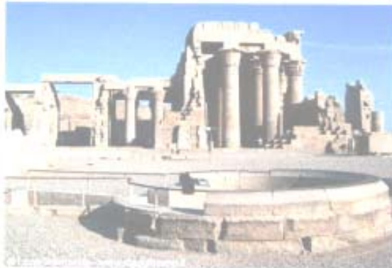
Il tempio di Kom-Ombo

Nel pomeriggio visita del Tempio di Kom-Ombo, l'unico consacrato a due