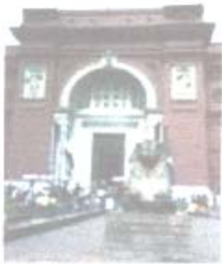
Il Cairo - Il museo egizio