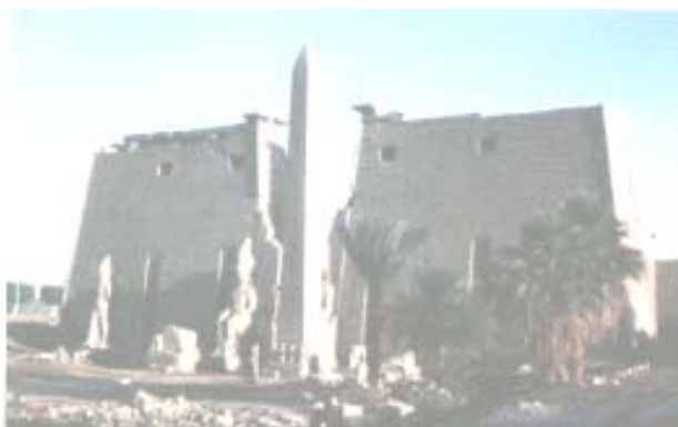
Il tempio di Luxor