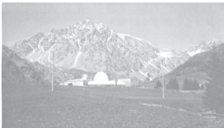
L'Osservatorio astronomico della Regione Valle d'Aosta di S. Barthélemy

Nel primo pomeriggio visita al Castello di Fenis. Successivo trasferimento all'Osservatorio Astronomico della Regione Autonoma Valle d'Aosta di Saint Barthélemy dove alle 16,30 ci sarà la visita alla struttura e l'osservazione del sole con la strumentazione in dotazione.