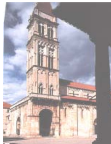
Trogir-Trou - Cattedrale di S. Lorenzo

viaggio verso sud, passando per Split/Spalato, fino a Metkovic . All'arrivo sistemazione in albergo per cena e pernottamento.