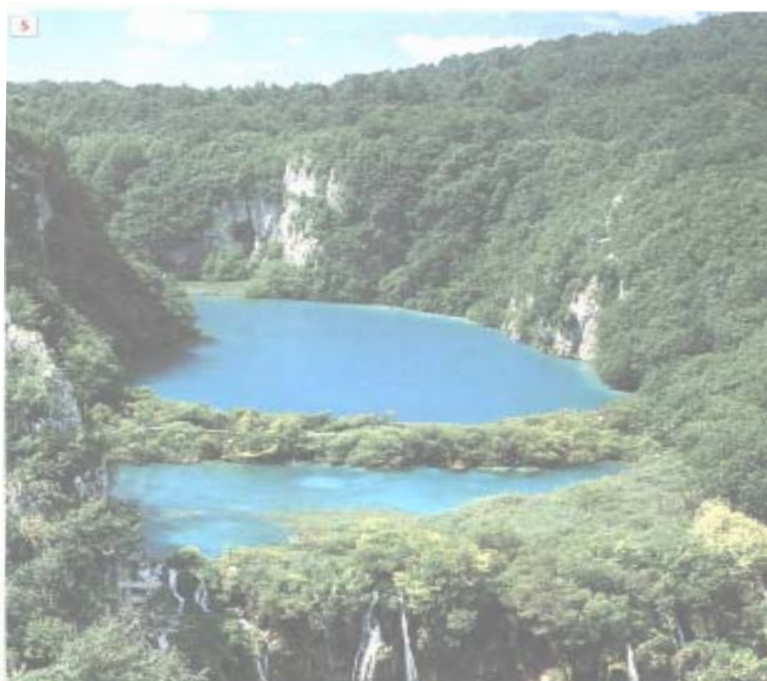
Un'immagine dei laghi di Plitvice