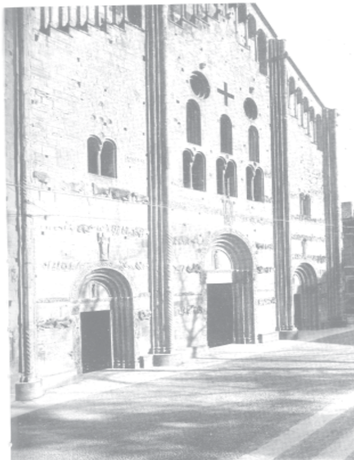
Pavia- Chiesa di S. Michele