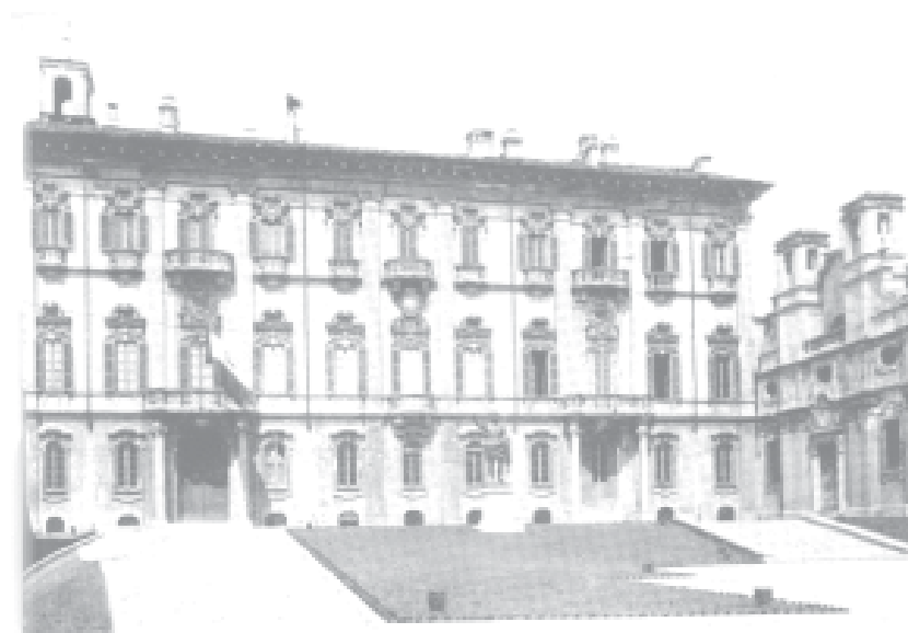
Pavia - Palazzo Mezzabarba