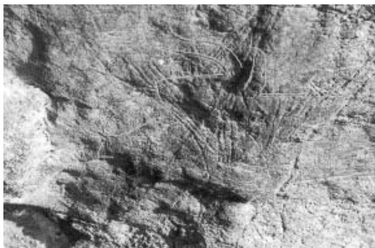
Fig. 2 - Il “cervide ritrovato” ed il “Bos” rinvenuto sulla parete della grotta.