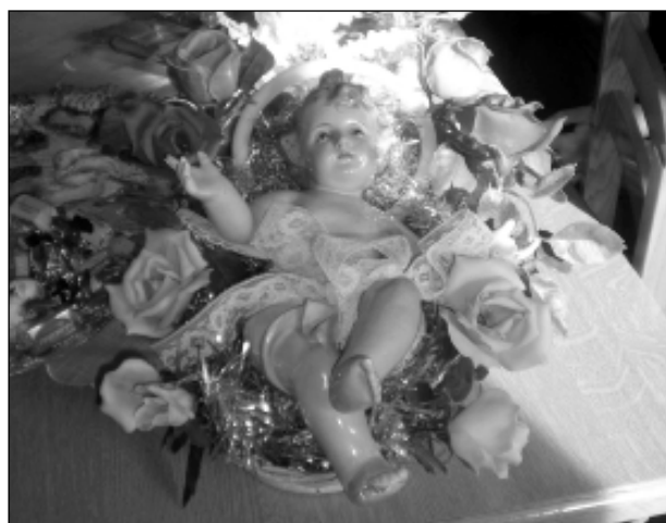
La statua del Bambinello in visita nelle case dei sannicolesi

SAN NICOLA DELL'ALTO - Continuano come programmate le festività natalizie Sannicolesi, ma quello che più meraviglia è la grande collaborazione che unisce la gente e la voglia di riuscire a completare il programma pur di offrire qualcosa di diverso alla gente rompendo quella monotonia invernale che di solito attanaglia tutti i paesi di montagna.