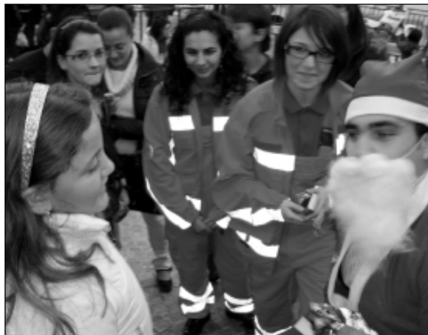
I pionieri di Melissa distribuiscono i doni

Inutile descrivere l'allegra dei più piccoli che, felici, facevano la fila per prendere il loro dono, incuriositi senz'altro più che dal regalo dall'uomo vesti-