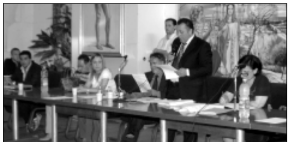
Una seduta del Consiglio comunale di Cirò Marina