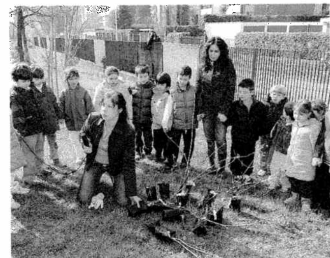
IN PRIMA LINEA Studenti-agricoltori per un giorno: anche loro hanno lavorato insieme alle insegnanti