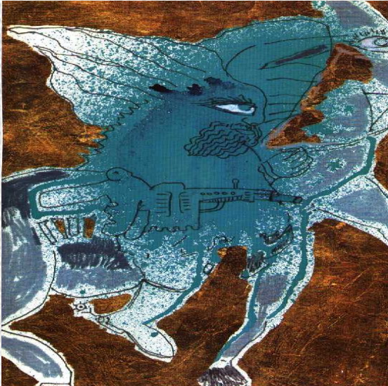
In copertina: Bellerofonte, 1993, matite e oro su cartoncino di Vittorio Traversi