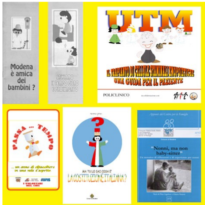
Alcuni dei miei libri