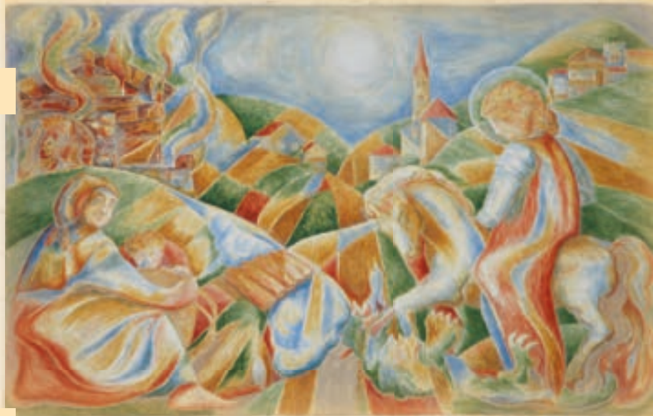
Le storie di Somor (1999) - Via Manzonega