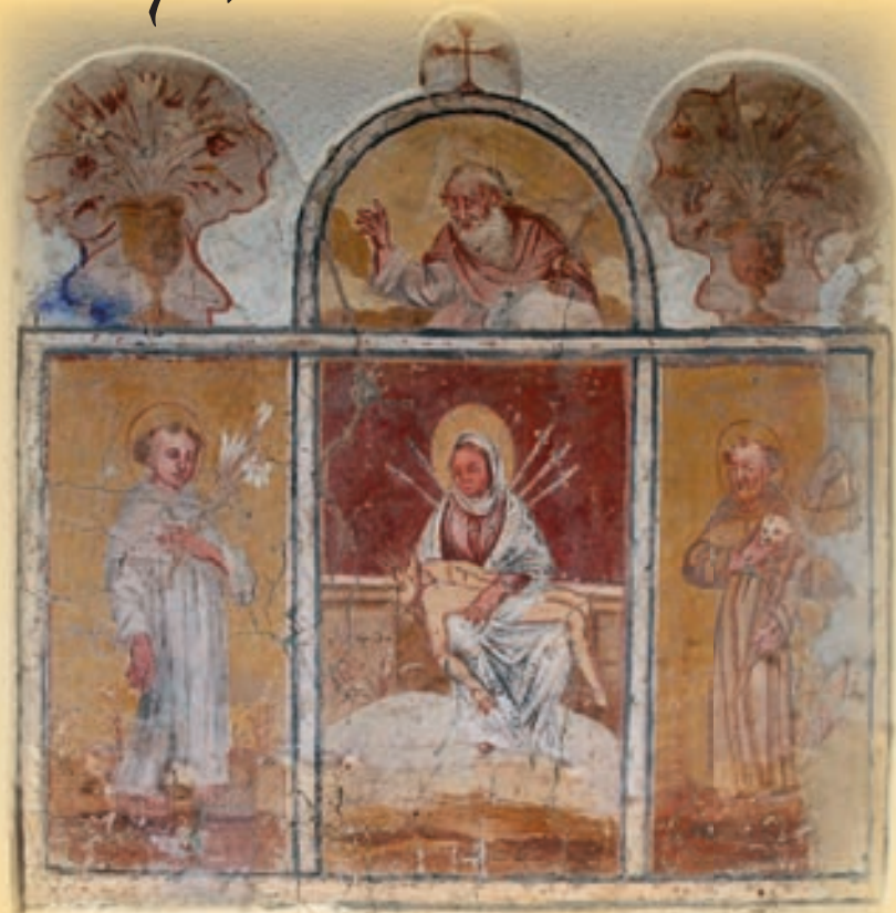
DALL'ALTO IN BASSO: Madonna Addolorata, Sant'Antonio e San Francesco (1740) - Ganz Madonna con Bambino e Santi Stefano, Antonio, Maddalena, Caterina e Lucia (1836) - Via Foca Madonna con Bambino e Santi Paolo e Giovanni Battista (XIX sec.) - Via Settimo Alpini