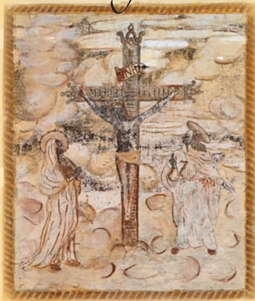
Crocifissione (XIX sec., con rifacimento moderno) - Via Molini