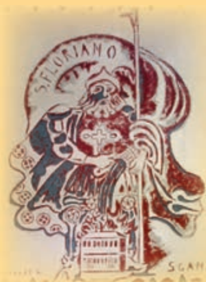
San Floriano - Via Garibaldi

Sappiamo poco, di San Floriano. La tradizione vuole lo si invochi contro gli incendi e le alluvioni, e che sia vissuto in area germanica, e che il suo culto sia particolarmente sentito nell'arco Alpino. In un atto di donazione del sec. VIII, si legge che il presbitero Reginolfo offriva ad una chiesa alcuni possedimenti siti "in loco nuncupante ad Puoche ubi preciosus martyr Florianus corpore requiescit" [Nel luogo denominato Puoche (=Buche, "il faggio", il sito della presente abbazia di san Floriano, vicino a Enns), dove riposa il prezioso martire Floriano con il suo corpo]. Alla metà dello stesso secolo venne scritta una passio, dove si dice che Floriano era un soldato romano, operante nei confini settentrionali dell'impero, sotto l'imperatore Diocleziano. Morì per la fede cristiana. Nacque al cielo il 4 maggio.