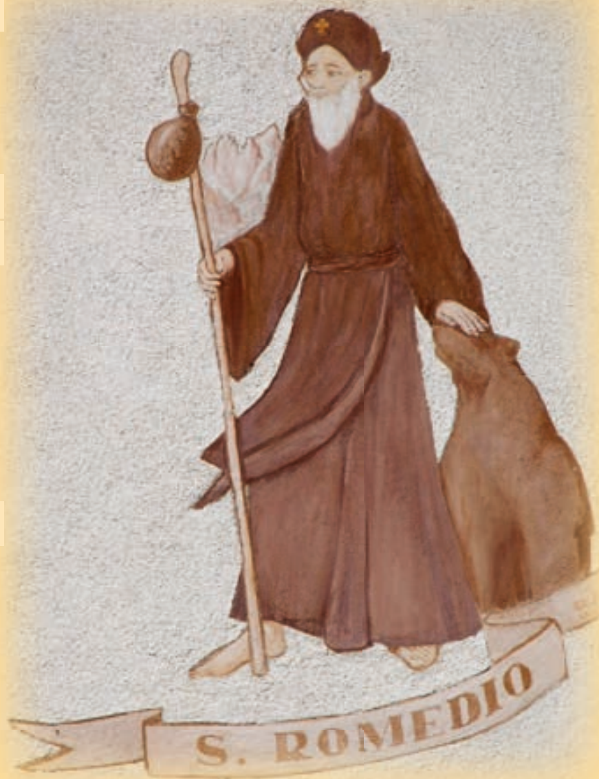
San Romedio - I Ganz