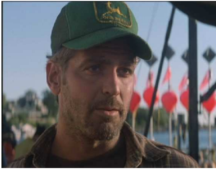
George Clooney (William 'Billy' Tyne)