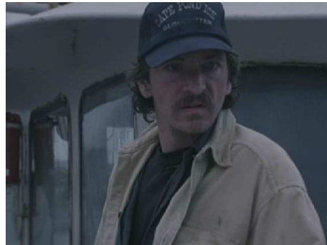
John Hawkes (Michael 'Bugsy' Moran)