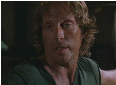
William Fichtner (David 'Sully' Sullivan)