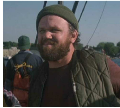
John C. Reilly (Dale 'Murph' Murphy)