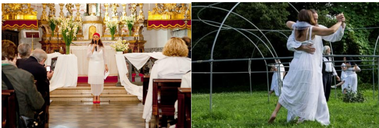
(dal film in programma "Poema Circular")

Le iniziative sono ad accesso libero e gratuito (per il concerto in Chiesa fino ad esaurimento posti).