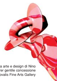
Opere tra arte e design di Nino Muscita.

Partner tecnici dell'iniziativa Torino Magazine e KULT Magazine.