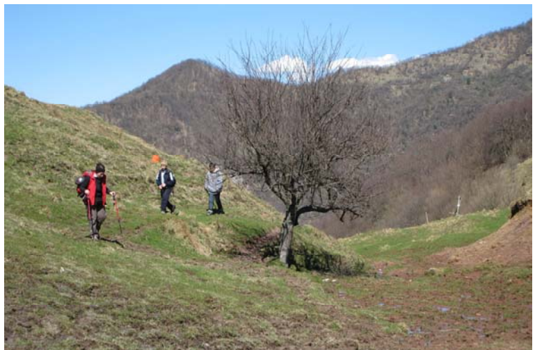
Arrivando alla Gola di Sisa, da dove con la strada del mattino si rientra a Creto