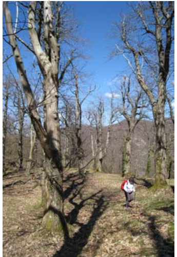
Dal lago si risale tutto per sentiero non segnato: si ripassa dalla frazione inferiore e si continua su una pista che rimonta direttamente fino alla Gola di Sisa