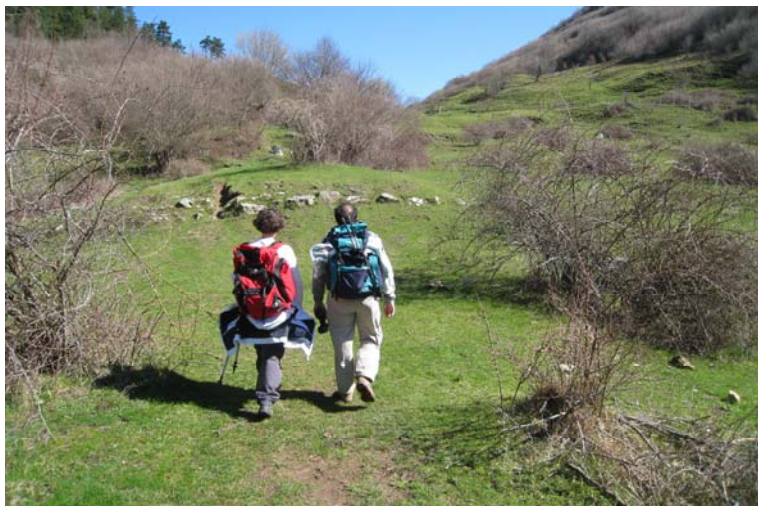
Salendo alla Gola di Sisa (poco meno di 1h) frazione superiore di Sanguinetto dove si abbandona il segnale. Con l'asfalto si arriva alla frazione inferiore (ad un bivio a destra). Qui tra le case una traccia scende al lago Val Noci