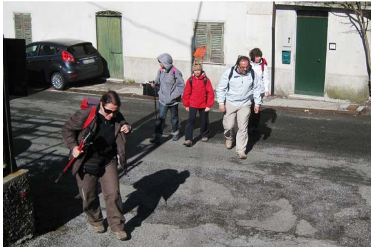
Partenza da Creto