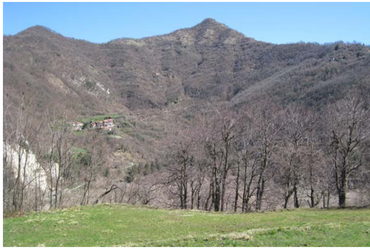
L'abitato di Caiasca e il Monte Bano 1036 m