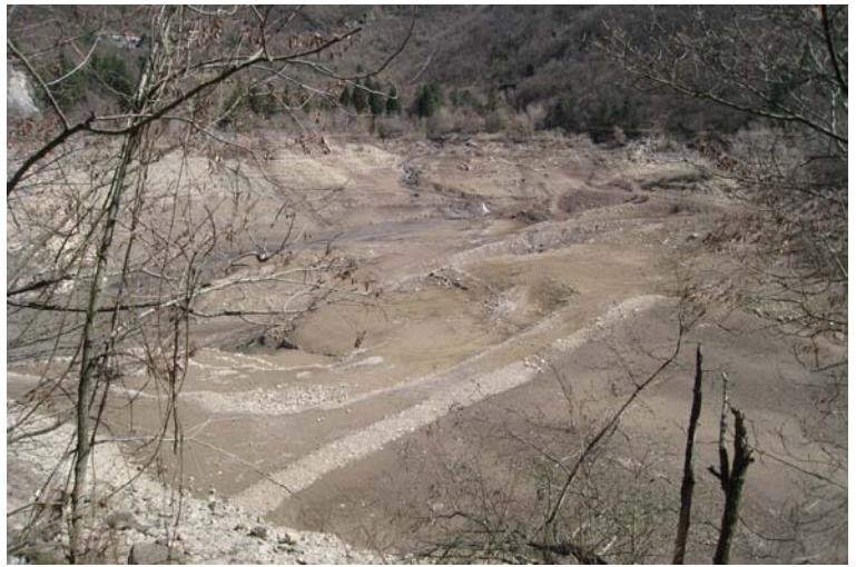
Il desolante aspetto del lago Val Noci... vuoto per manutenzione (1h x arrivarci)