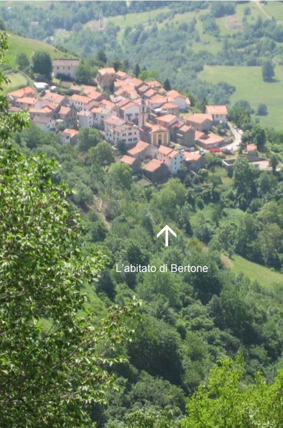
Si parte da Bertone 1068m dopo 8 km di strada stretta (pochi parcheggi); si sale tra le case e in 2' vicino a una fonte si piega a sinistra in piano, passando sotto un archivolto (2 triangoli gialli e non i simboli CAI che si utilizzano al ritorno)