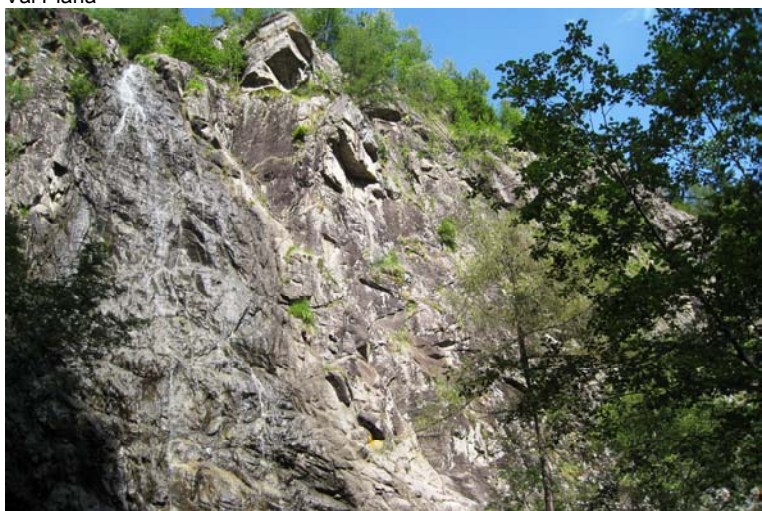
La cascata del Sass Pissador in Val Piana