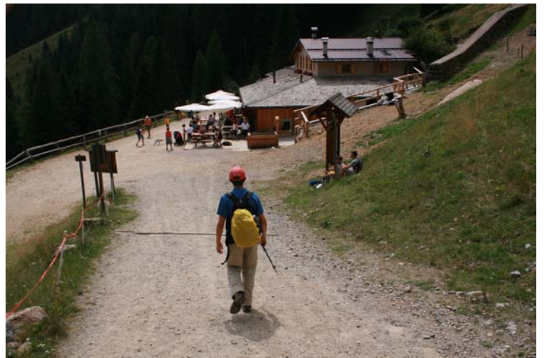
ritorno a Malga Stablasol in 1h