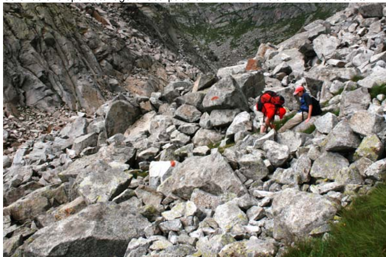
Difficoltà nel rientro... Escursione faticosa e alla fine poco remunerativa