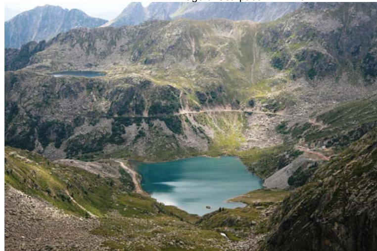
il lago di Cornisiello (2110 mt) e a sin in alto il lago Nero (2233 mt)