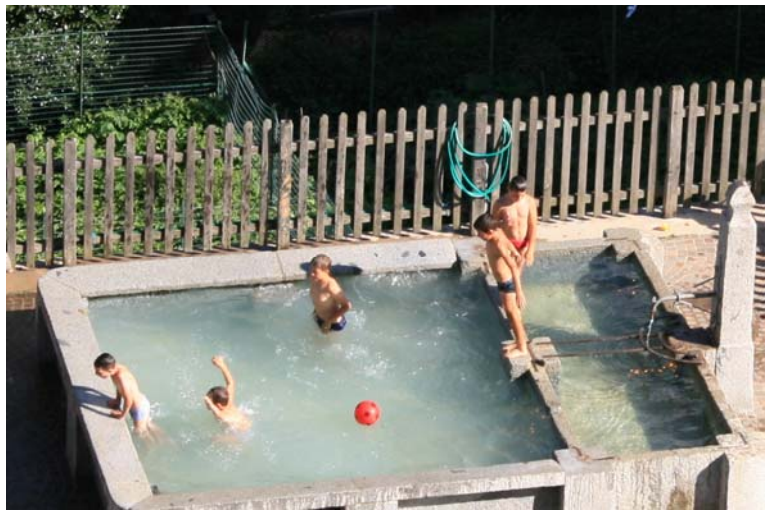
così caldo da fare il bagno... nella vasca della fontana...