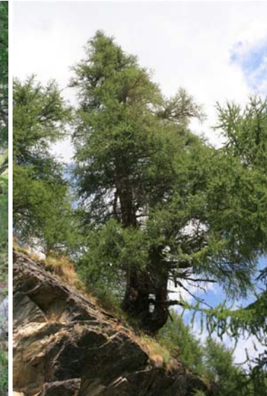
vive nella roccia, 400 anni