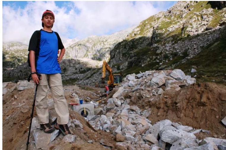
sono lavori per sistemare l'impianto idrico della zona