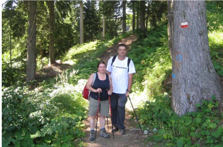
Salita a piedi direttamente dall'albergo (450 mt di disl – circa 2h - attenzione ad un bivio mal segnato, seguire sempre la strada a sinistra più evidente) alla malga