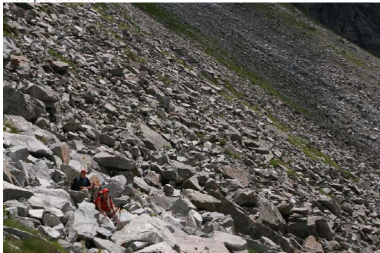
Salendo allo sperduto lago di Scarpacò con il n. 216 in oltre 2h di dura salita