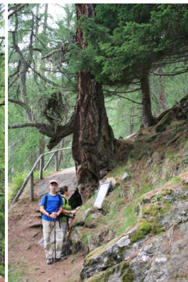
la tana, 400 anni