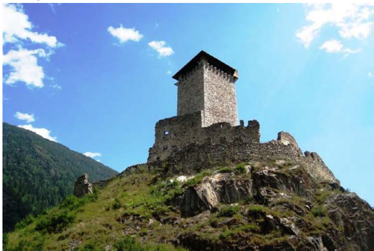
castello di San Michele a Ossana