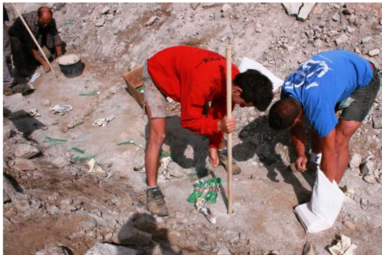
Sono in corso lavori... con brillamento di dinamite, qui sistemata...!!!!!!!!!!!!!!!!!!!!