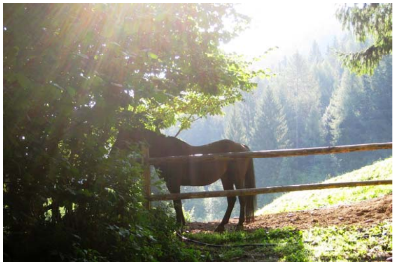
salendo verso la Val Piana