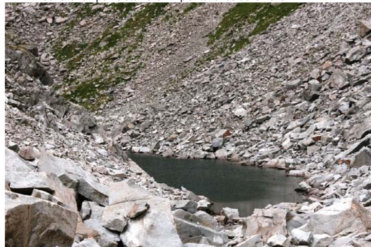
lago di Scarpacò 2472 mt