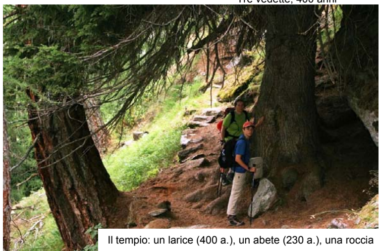
Il tempio: un larice (400 a.), un abete (230 a.), una roccia