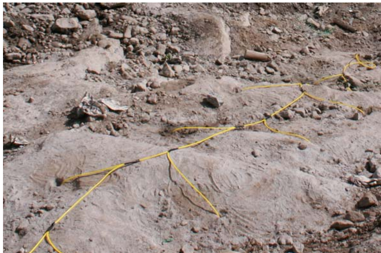
Micce pronte all'uso...