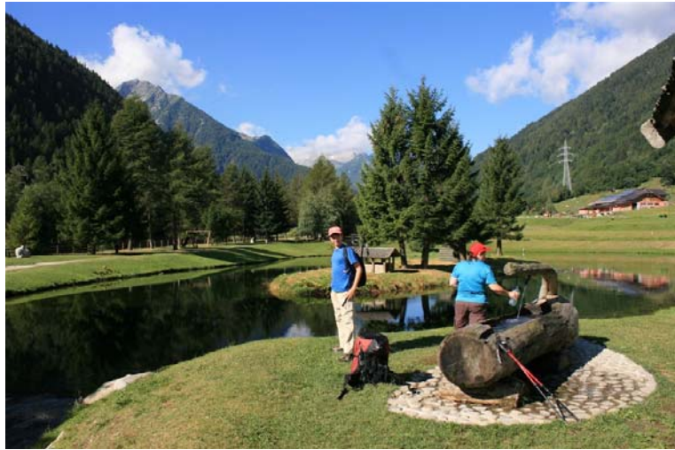
Lagheti di San Leonardo a Vermiglio a 1200 mt