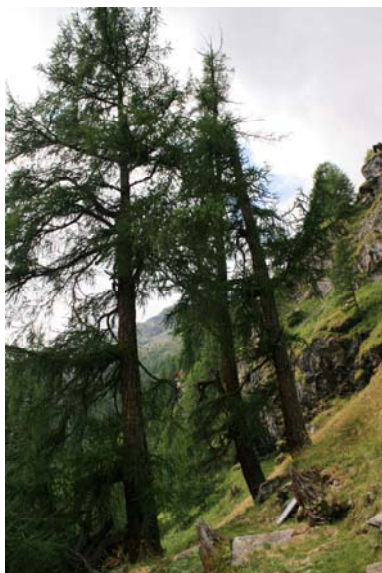
Tre vedette, 400 anni