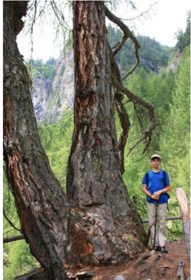
due vite, 400 anni

Ecco una serie di foto che si soffermano su alcuni dei 23 esemplari di larici monumentali... il tracciato è stato realizzato con ben 700 scalini