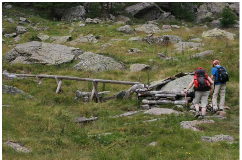
Giochi d'acqua presso malga Vecia 1890 mt da qui si rientra direttamente con il n. 106