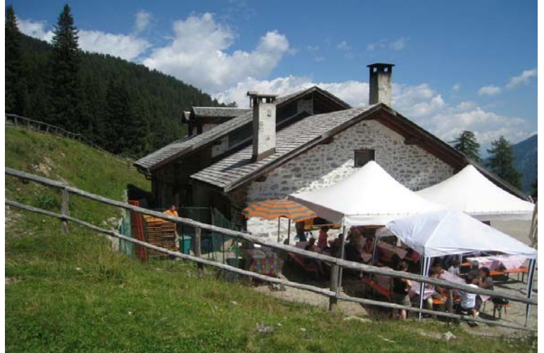
Dimaro, ... dove c'è la festa del hotel Derby (polenta di Storo con spezzatino !!!)