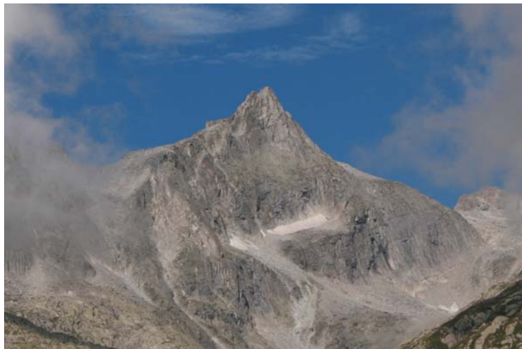
Punta Cornisiello in val Nambrone dal parcheggio a 2080 mt