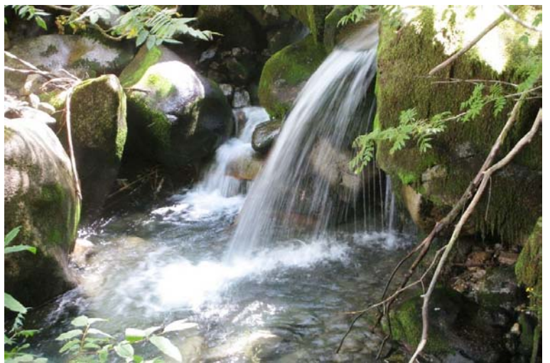
Lungo il sentiero "de la Lec" per rientrare ad Ossana