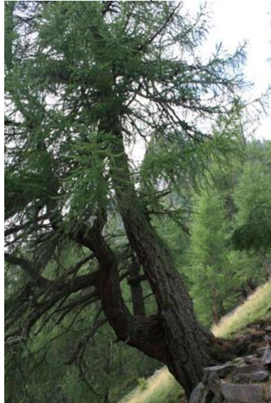
grande arco, 300 anni