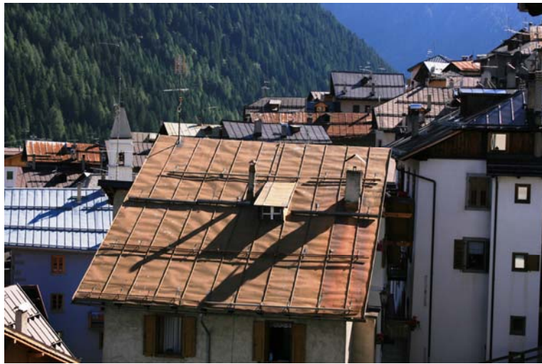
I tetti di Vermiglio