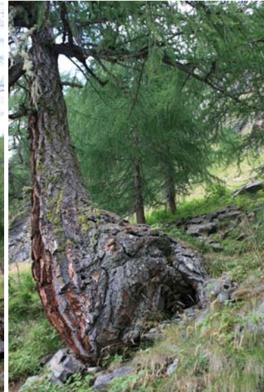
grande piede, 300 anni