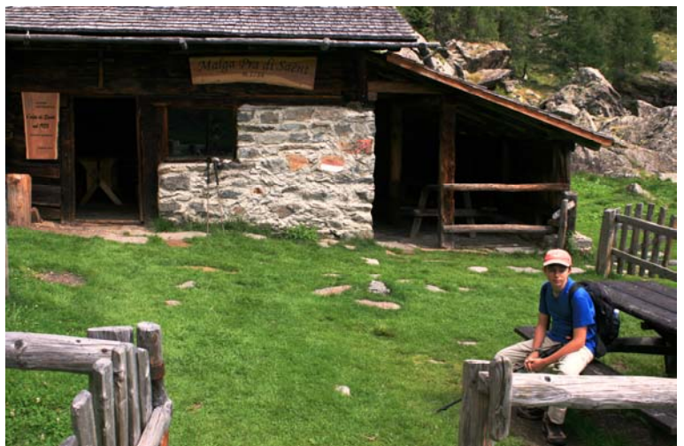
In val di Rabbi c'è la scalinata di larici monumentali. In auto, passando da Cavallar (e non dalle Terme di Rabbi) si arriva al parcheggio di Coler 1360 mt dove con il bus si sale a Malga Stablosol 1530 mt. Superato a piedi il centro visita Stablet 1590 mt si rimonta la dorsale fino al riparo Doss de la Cross (n.106). Di lì, si scende ai prati di Saent con relativa malga (1h) da cui parte il sentiero (si lascia il n.106) che in 90 minuti fa vedere tutti gli alberi fino a quota 2000 circa