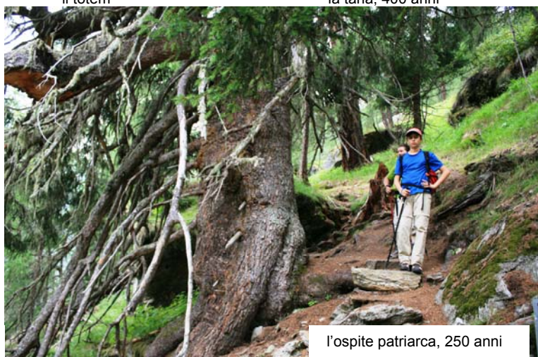
l'ospite patriarca, 250 anni