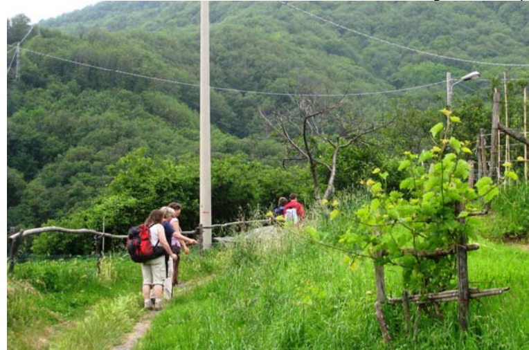
Altre info al link http://www.quotazero.com/articolo.php?id=7