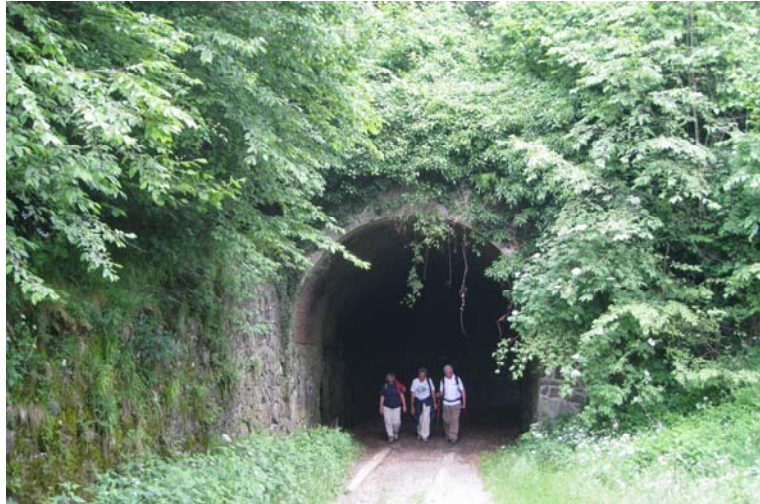
Si attraversano pure due gallerie di 50 e 25 metri