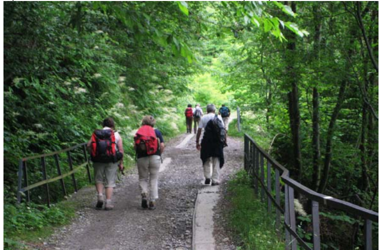
Il tracciato ha una pendenza abbastanza dolce e costante e si cammina bene