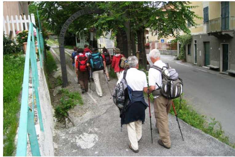
Dalla località Gaiazza, si sale sfruttando il tracciato della vecchia guidovia che per quasi 40 anni, tra il 1929 e il 1967, ha costituito la principale via di accesso