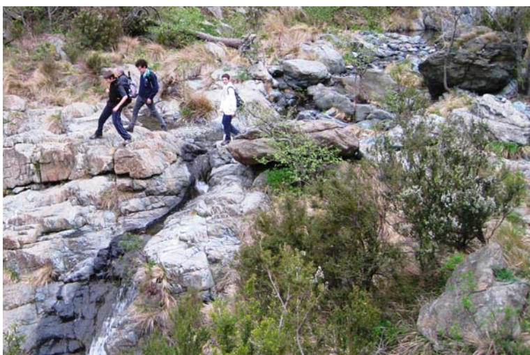
Deviazione che non si conosceva e si è fatta volentieri, nella parte bassa, all'imbocco con il sentiero principale, NON c'è nessuna indicazione...