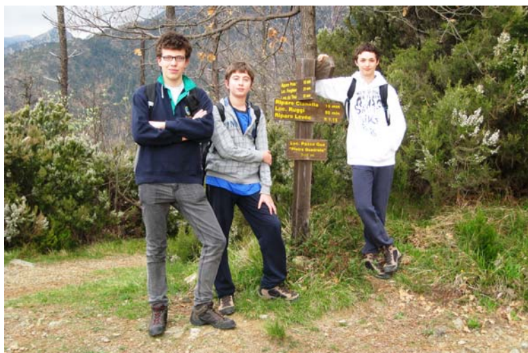
Dal passo Gua