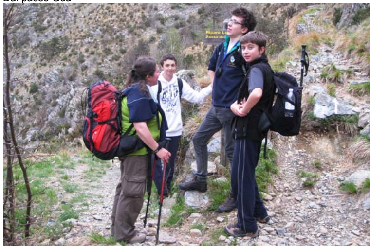
Bivio per il rip Levee, si prosegue a sinistra