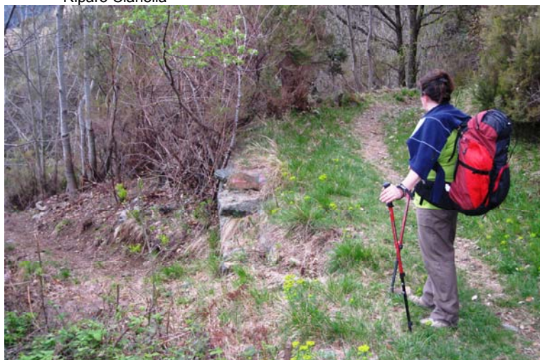
10' e si trova un bivio poco evidente che con una traccia secondaria porta sul Sentiero diretto al lago da Tina; mentre, proseguendo dritti, si andrebbe a Ruggi...