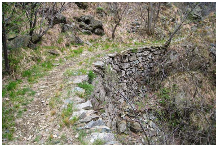
Poi, si ritrova il bivio del mattino e si ricalca la strada dell'andata fino all'auto...