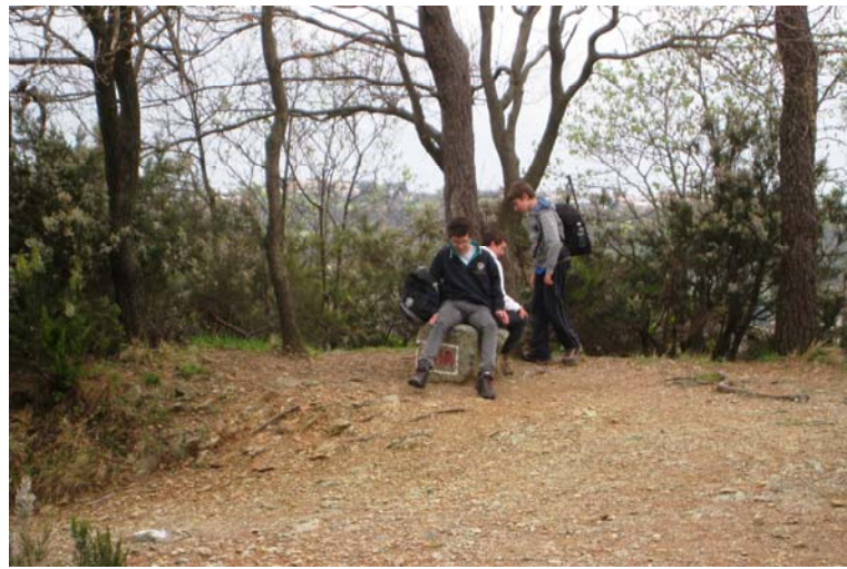
Quasi 90' all'andata fino al lago da Tina – 50 per Ruggi e altri 90' x la macchina presso l'Agueta (diff. medio bassa poco più di 300 m di disl. complessivi)