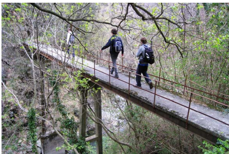
I due ponti presso Ruggi