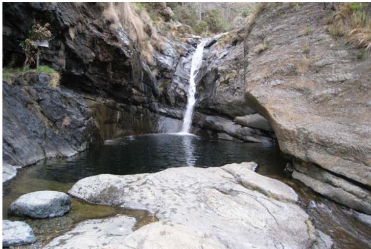
Lago da Tina, piccolo ma profondo 6 metri!