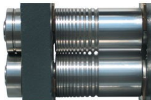
CASTELLO LASTRA FILO