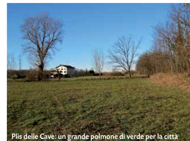
Plis delle Cave: un grande polmone di verde per la città

Tra i principali obiettivi che Vivere Cernusco si era posto, quando ancora conduceva le sue battaglie politiche dai banchi dell'opposizione, c'era quello di salvaguardare la grande area verde a nordovest del cosiddetto Parco delle Cave. La precedente Amministrazione aveva previsto l'istituzione, con i comuni di Carugate, Brugherio, Vimodrone e Cologno di un PLIS (Parco Locale di Interesse Sovracomunale) ma con un limitato conferimento di aree. L'Assessore al Territorio non solo ha portato all'approvazione in consiglio comunale la convenzione per l'istituzione del Parco, ma ha impegnato il Comune, tramite il nuovo Piano di Governo del Territorio, a conferire al Parco aree per ben 3.000.000 di mq, contro i 750.000 previsti dall'amministrazione Cassamagnaghi. Un obiettivo importante, coerente con l'impegno sviluppato in tutti questi anni da Vivere Cernusco, che salva da edificazioni residenziali una grande area verde, una cintura naturale che salvaguarda Cernusco da possibili saldature con le città limitrofe.