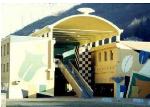
Forum Vista parte centrale

Al primo piano ad aspettarvi troverete personale autorizzato che si occuperà della Vostra Prima accoglienza.