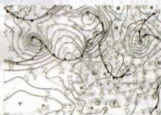
Mappa FAX da DWDsat

Immagini digitali perfette con una parabola di 85 cm. puntata su HotBird a 13°E. Il nuovo satellite MSG ha ben 12 radiometri in funzione di cui uno, ad alta definizione, con risoluzione di circa un Km/pixel. Aggiornamento immagini ogni 15 minuti.