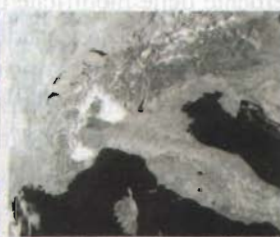
NOAA HRPT da DWDsat

Le immagini digitali e di altissima qualità sono criptate e compresse con speciali algoritmi. Per riceverle è necessario essere abilitati da Eumetsat che fornisce una password personale e la chiave USB di decrittazione, per gestirle e visualizzarle occorre il nostro software.