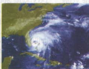
GOES 75° W da MSG LRIT