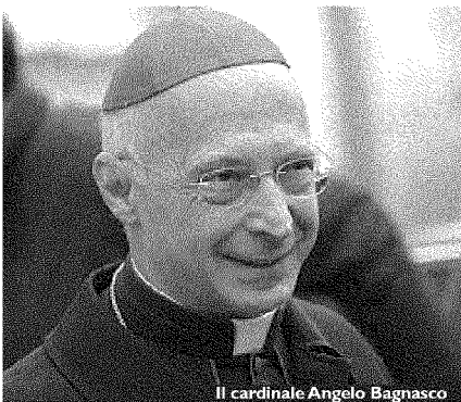
Il cardinale Angelo Bagnasco