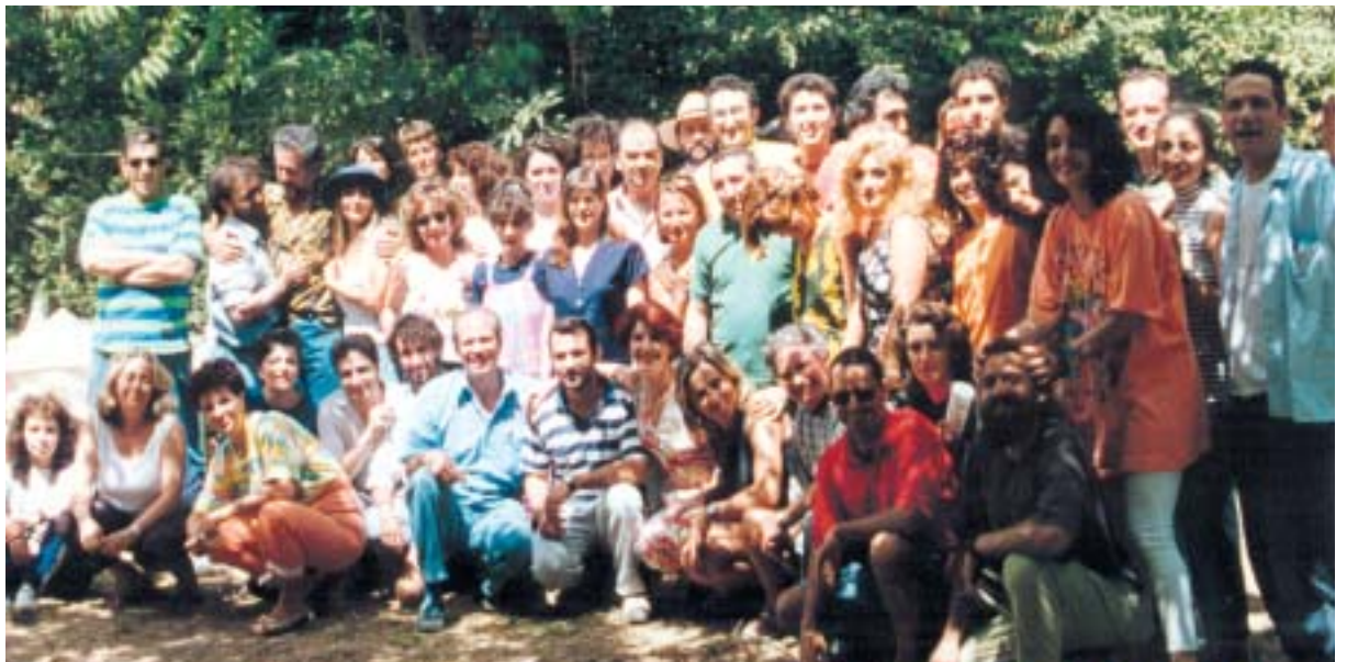
Gruppi di formazione estivi