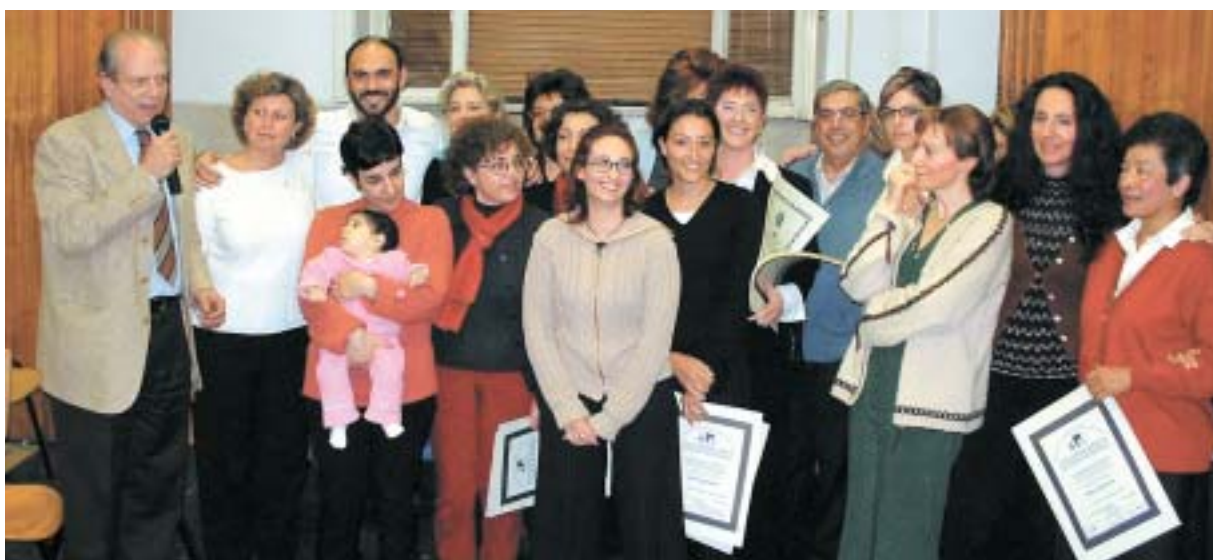
Diplomati Master in Counseling Professionale