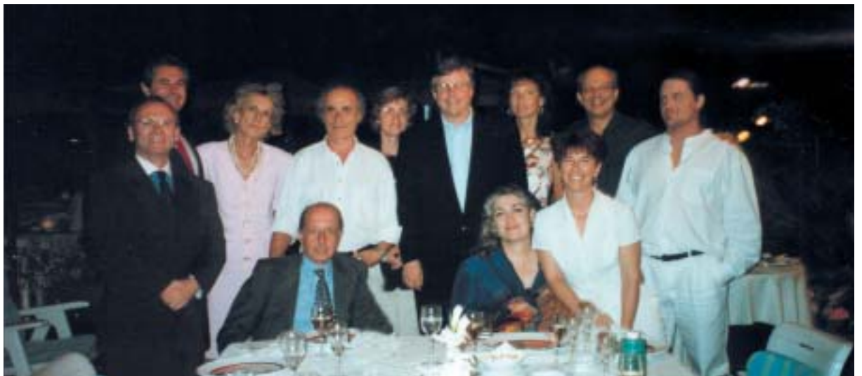
Congresso della European Association for Psychotherapy a Roma