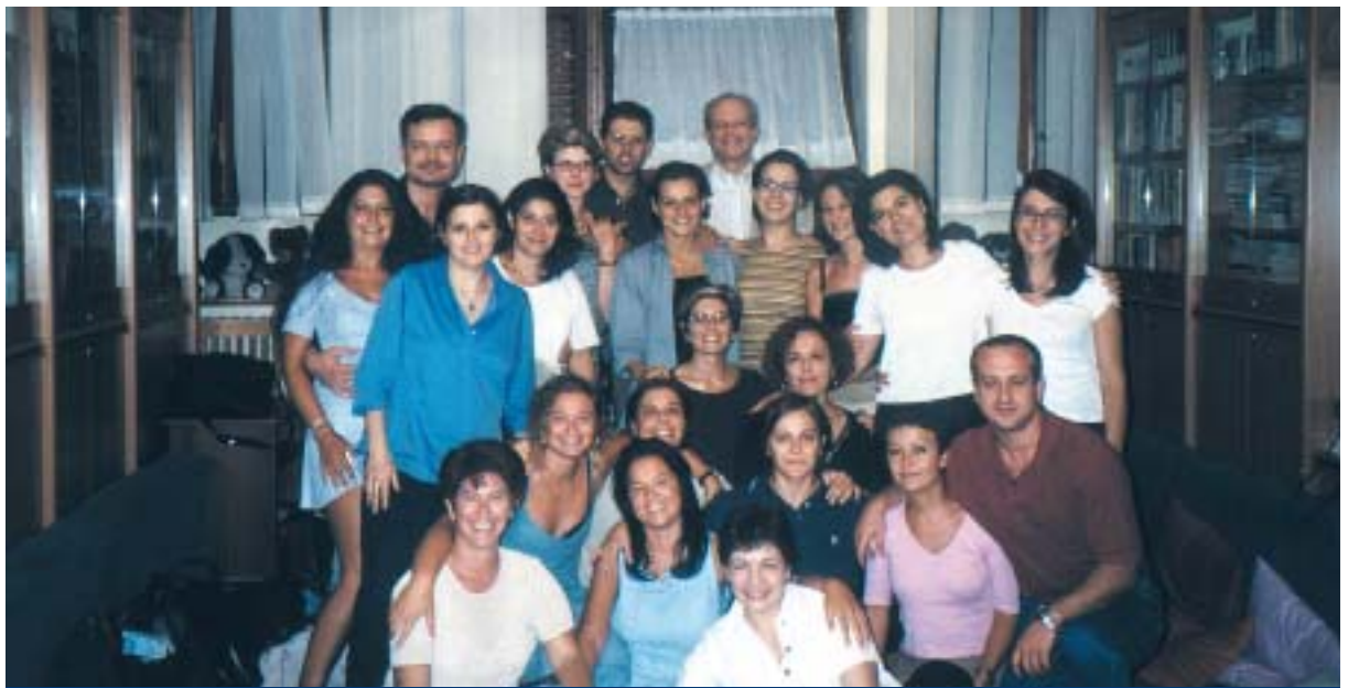
Scuola di specializzazione per psicoterapeuti