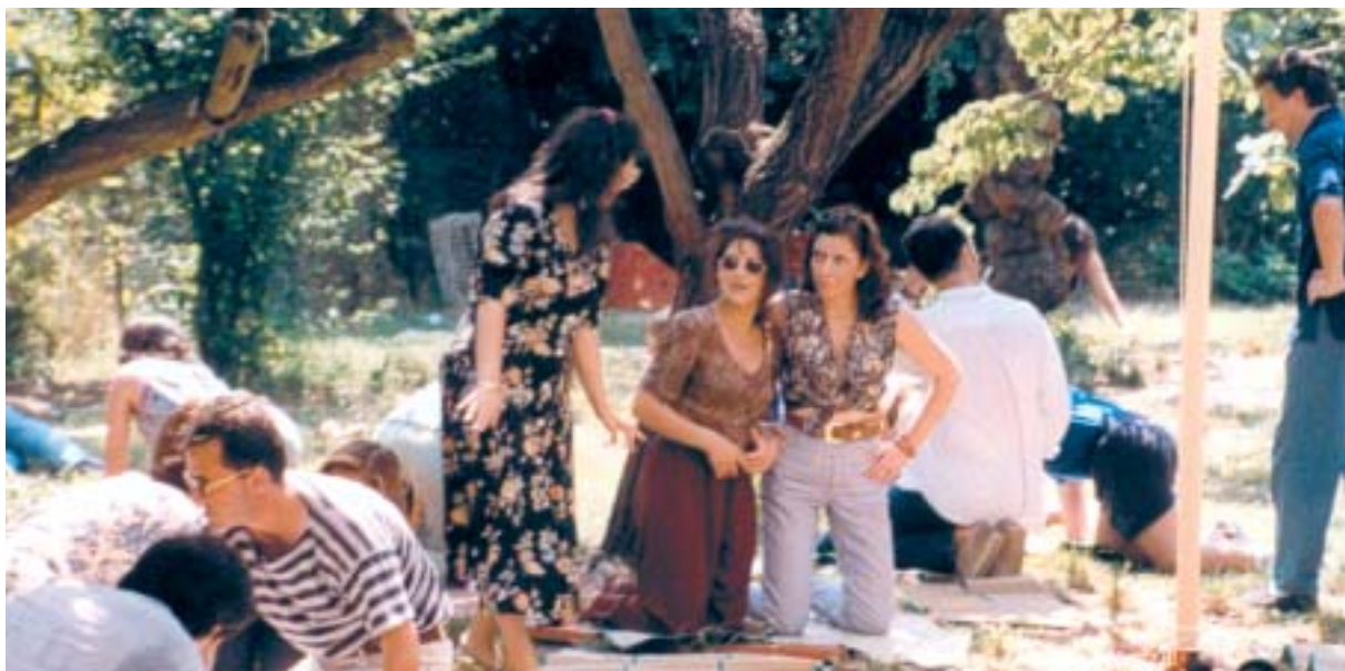
San Gregorio al Celio: maratona estiva