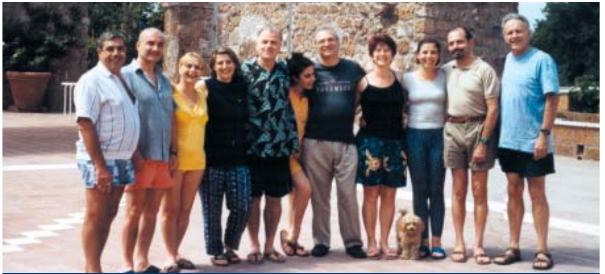
Aggiornamento Body Mind Integration