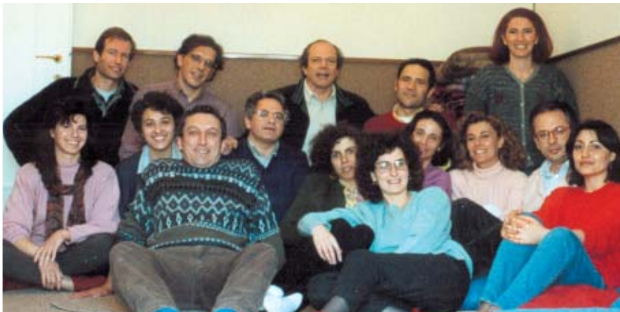
Lungotevere: la prima sede