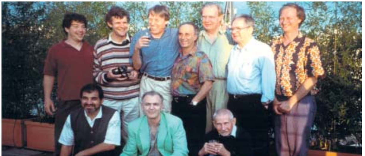
Maschile e Femminile della Forge "Federazione Internazionale des Organismes de Formation à la Gestalt"