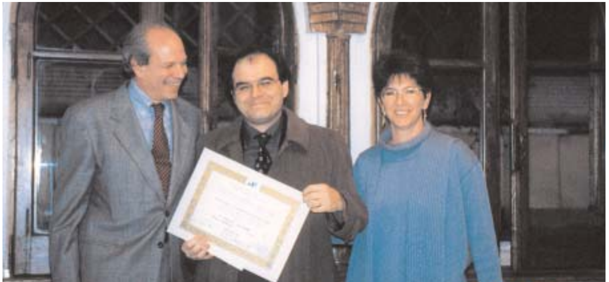
La ricerca scientifica in itinere