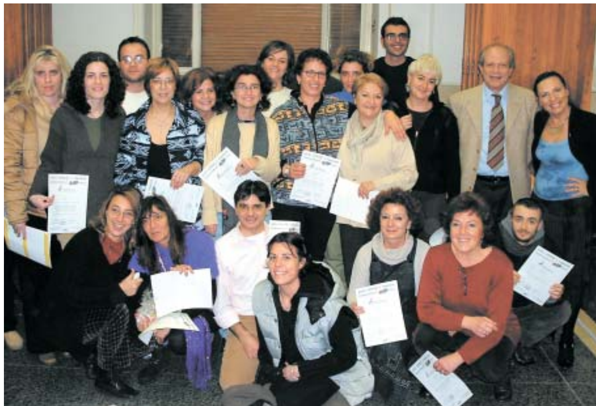
Diplomati Master in ArteTerapia e Counseling Espressivo