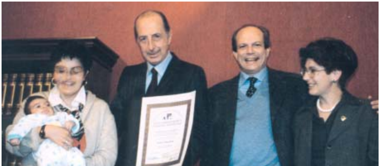
Presso l'Istituto dell'Enciclopedia Italiana di Giovanni Treccani