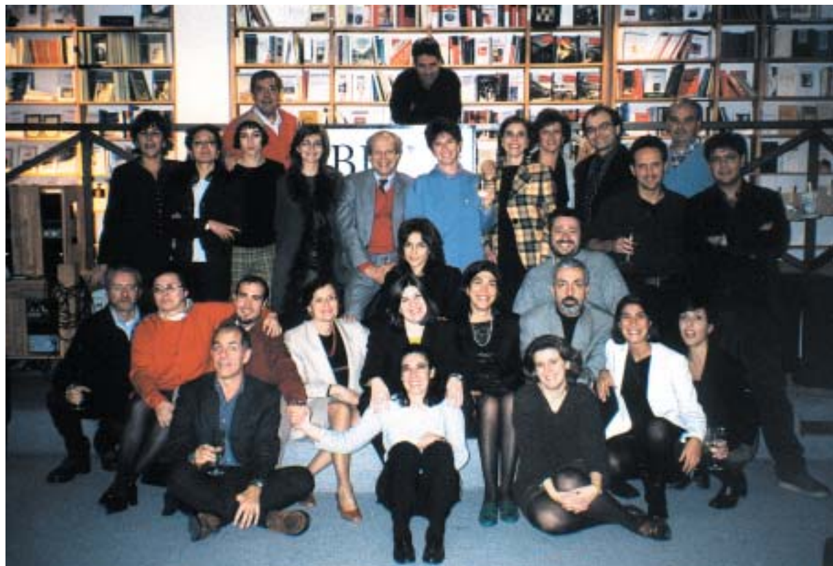
Un caloroso invito dagli allievi presso il Bibli-Caffé