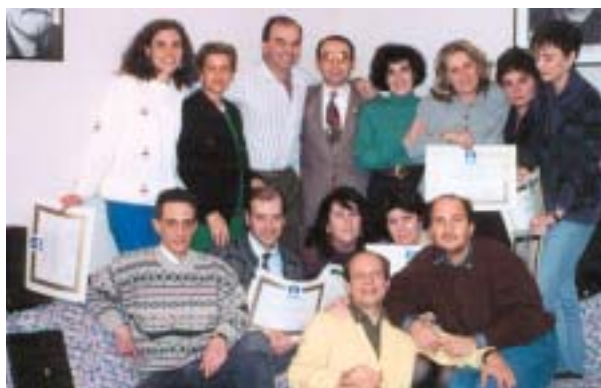
Con i primi diplomati