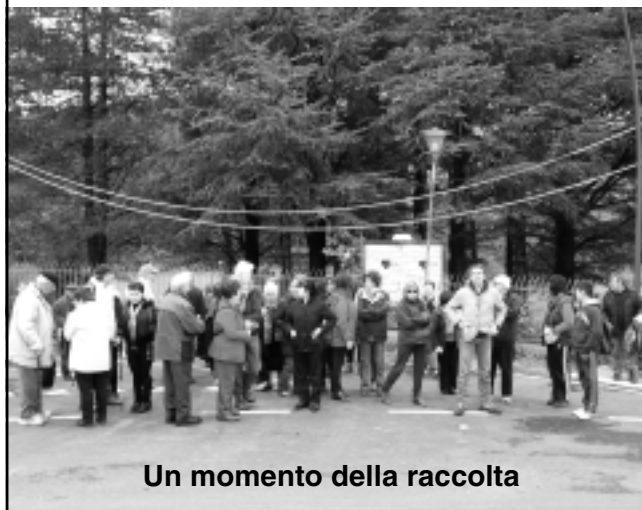
Un momento della raccolta

Ancora stanno bollendo le castagne raccolte nelle case dei partecipanti all'uscita delle "Castagne" a Bagno di Romagna, una giornata immersa nella natura completata da pranzo in Fattoria, il prossimo anno si torna!