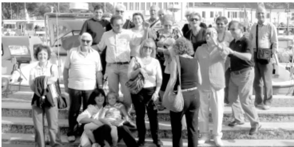
Il gruppo in posa a Cesena per la tradizione della foto ricordo

Per tradizione ormai alleghiamo alcune foto dell'evento anche per ricordare agli assenti quanto hanno perso!