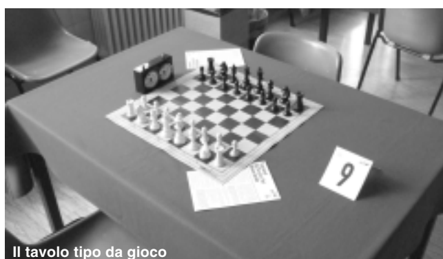
Il tavolo tipo da gioco

Sindaco e Assessore premano il vincitore