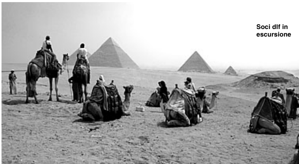
Soci dlf in escursione

Il titolo apparentemente esagerato si attanaglia bene invece al momento che il DLF sta oggi vivendo. Aumentano i rapporti in convenzione per i tesserati con le realtà commerciali più disparate del territorio ed anche quest'anno ci sono le agevolazioni per l'abbonamento alla stagione del Teatro Gentile mentre sono in corso trattative per l'utilizzazione agevolata della nuova piscina comunale.