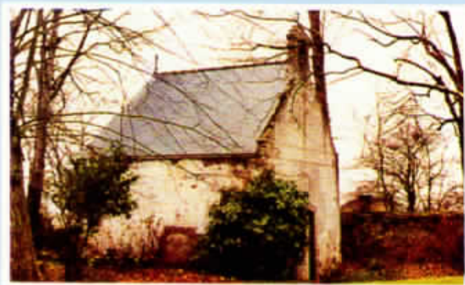
Cappella della "Fosse Ringot" dove il Padre ebbe la prima ispirazione delle Società

1814: il Padre Generale della Compagnia di Gesù lo incarica di ristabilire in Francia la Compagnia.