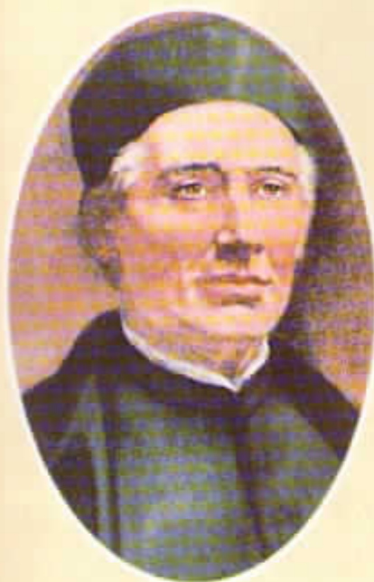
PADRE GIUSEPPE PICOT DE CLORIVIÈRE