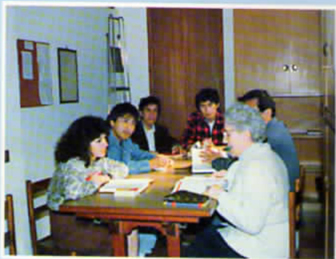
Giovanna a Milano: catechesi e scuola a peruviani