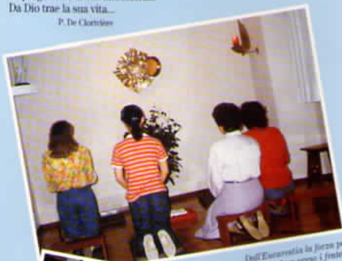
Dall'Eucarestia la forza per andare verso i fratelli