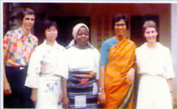
Figlie del Cuore di Maria di quattro continenti

L'amore di Cristo ci ha riunite per diventare una sola realtà.