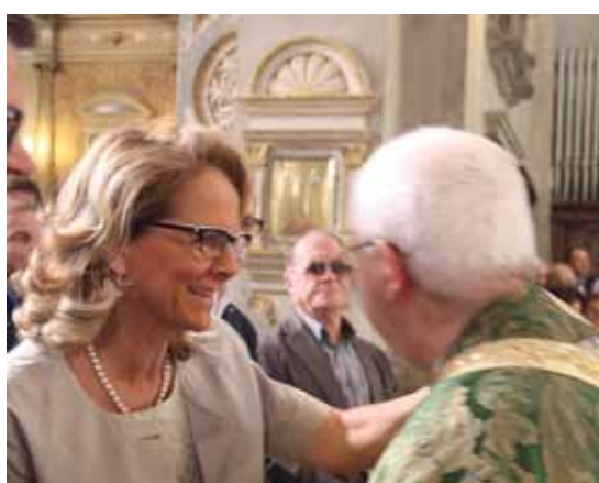
Il primo cittadino