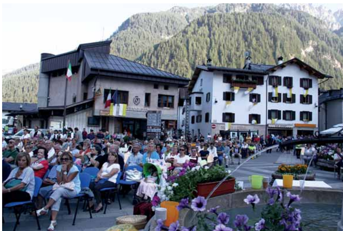
La piazza gremita

Nel trentottesimo anniversario dell'elezione al soglio di Pietro del patriarca di Venezia Albino Luciani, rivive l'emozione provata da molti all'Habemus Papam, seguito dal commovente annuncio "Albinum Luciani". "Il suo universale messaggio di carità e di fede cristiana è attuale" ha ricordato il segretario di Stato Pietro Parolin davanti al grande pubblico dei fedeli convenuti nella piazza di Canale d'Agordo. «Malgrado il brevissimo pontificato, il suo messaggio e la sua figura non verranno dimenticati» è stato ripetuto negli interventi che hanno preceduto la celebrazione eucaristica e l'inaugurazione del museo-centro studi allestito nel palazzo accanto alla chiesa. Un allestimento semplice e pulito, con documenti importanti e curiosi, e fotografie di grandi dimensioni, relative alle varie fasi dell'attività pastorale, tra le quali una gigantografia ripresa a Oderzo.