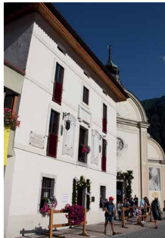
Il nuovo museo Papa Luciani

Nel trentottesimo anniversario dell'elezione al soglio di Pietro del patriarca di Venezia Albino Luciani, rivive l'emozione provata da molti all'Habemus Papam, seguito dal commovente annuncio "Albinum Luciani". "Il suo universale messaggio di carità e di fede cristiana è attuale" ha ricordato il segretario di Stato Pietro Parolin davanti al grande pubblico dei fedeli convenuti nella piazza di Canale d'Agordo. «Malgrado il brevissimo pontificato, il suo messaggio e la sua figura non verranno dimenticati» è stato ripetuto negli interventi che hanno preceduto la celebrazione eucaristica e l'inaugurazione del museo-centro studi allestito nel palazzo accanto alla chiesa. Un allestimento semplice e pulito, con documenti importanti e curiosi, e fotografie di grandi dimensioni, relative alle varie fasi dell'attività pastorale, tra le quali una gigantografia ripresa a Oderzo.