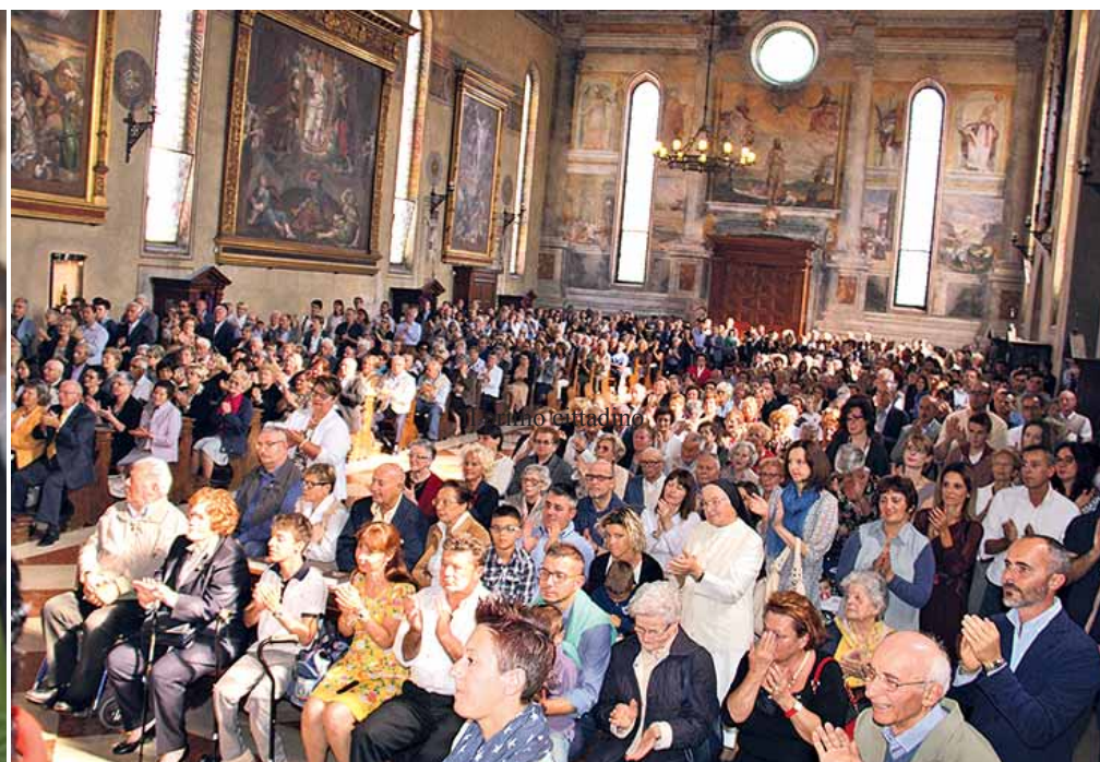
Duomo con la partecipazione delle grandi occasioni