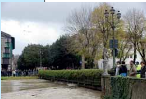
La piena del Monticano all'altezza del ponte sulla piazza l'11 novembre 2012

* Saluto alla comunità per mons. Piersante Dametto, al termine di un servizio di ventiquattro anni esatti, nel quale ha saputo coniugare la profondità del pensiero teologico alla pratica quotidiana del servizio pastorale. Numerose le attestazioni di profonda stima arrivate anche da persone magari lontane, attratte dalla sua dedizione. La liturgia di saluto - al tempo stesso familiare e solenne, concele-