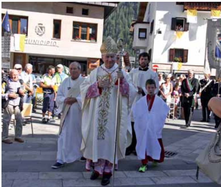
Il card. Pietro Parolin, segretario di Stato Vaticano

A trent'otto anni da quell'Habemus Papam procede la causa di beatificazione di Albino Luciani