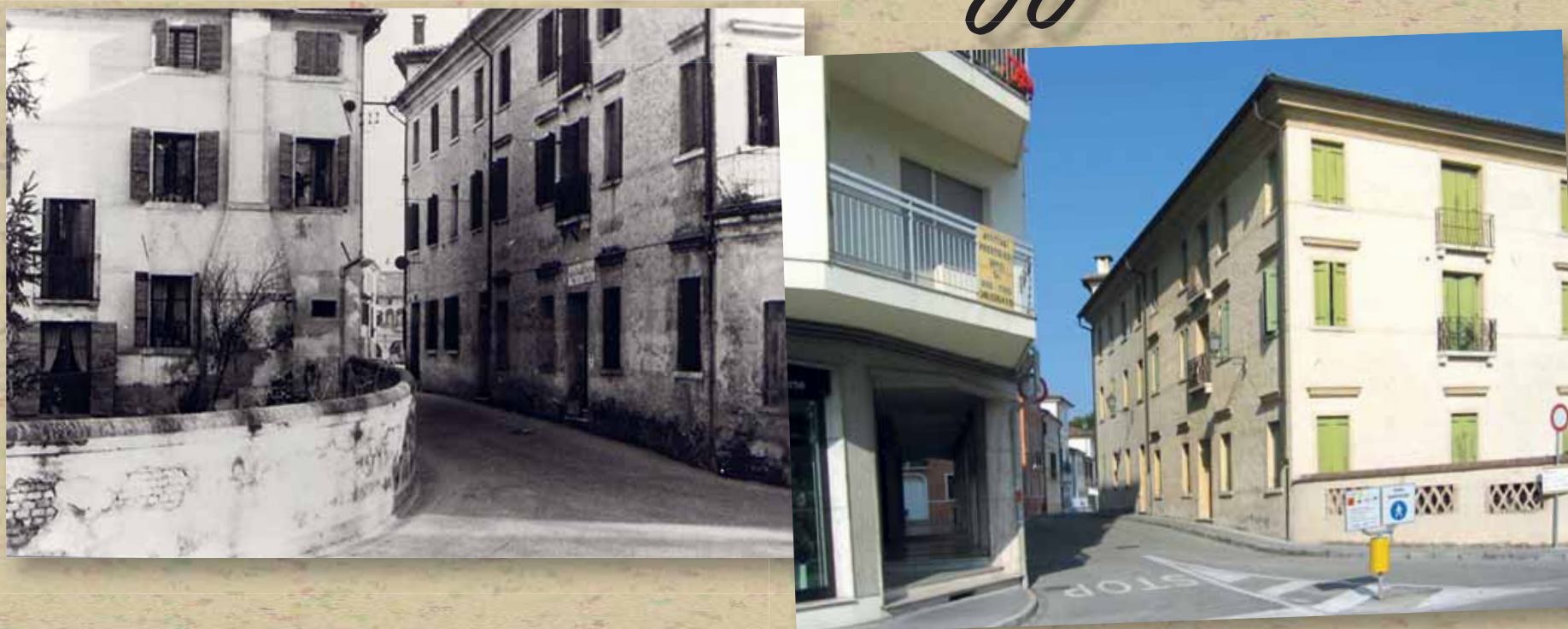
La vecchia e nobile costruzione di «Casa Benzon» in Campiello del Duomo abbattuta negli anni Sessanta per innalzare un edificio a più piani di stile moderno, poco coerente con il contesto architettonico dei fabbricati sette-ottocenteschi prospicienti la casa canonica.