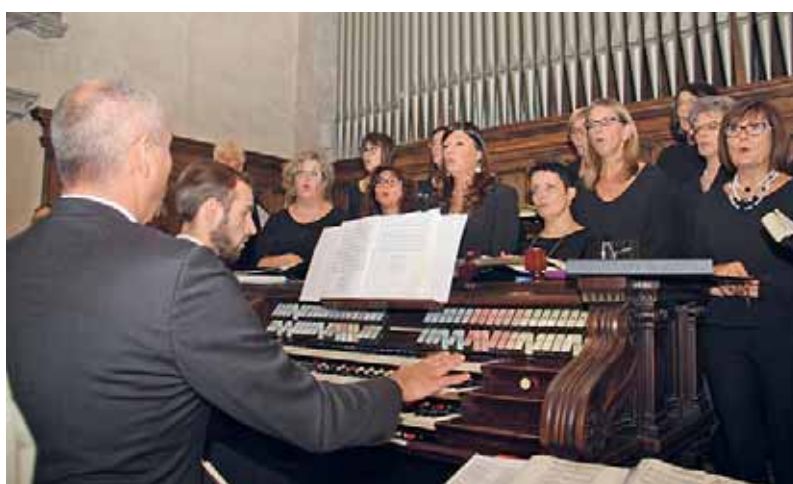
La corale del Duomo (inquadratura parziale)