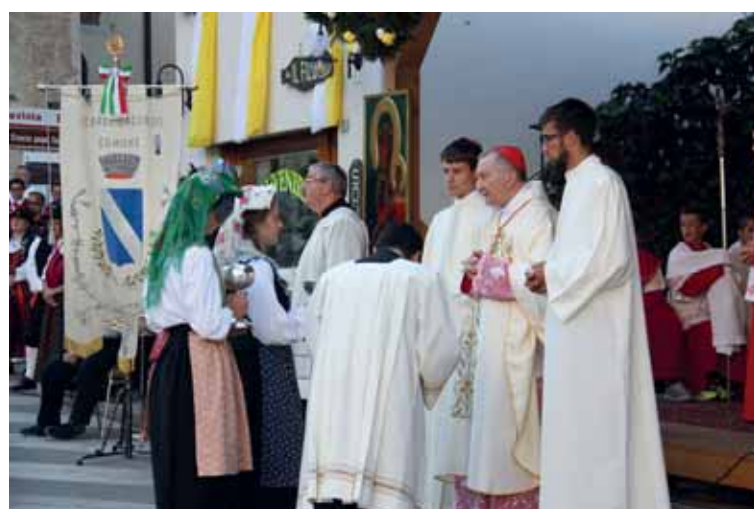
Il momento delle offerte