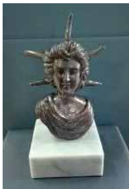
Il busto del sole, statuetta simbolo del premio, diviso in 4 sezioni: oltre 400 gli elaborati esaminati

Durante tutta la “settimana” sarà proposta una “passeggiata” per il centro storico dal filo conduttore della poesia.