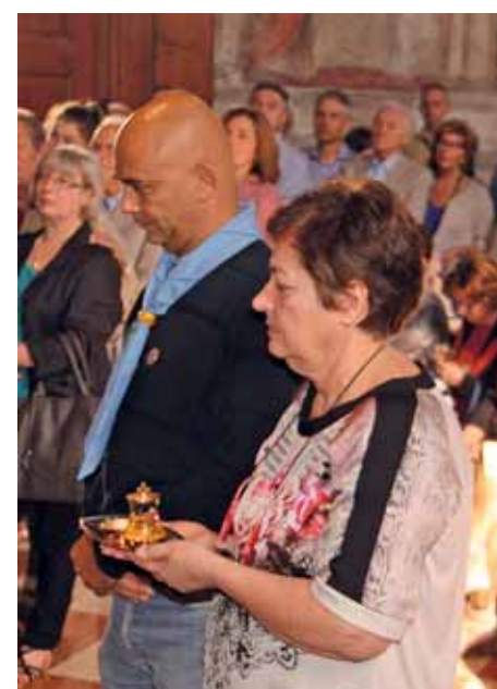
La presentazione delle offerte