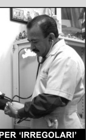
VISITE ANCHE PER 'IRREGOLARI'

COSTI ANCHE PER LO STRANIERO NON IN REGOLA CON IL PERMESSO DI SOGGIORNO. In tal caso lo straniero effettua una dichiarazione in cui manifesta di essere in stato di indigenza e privo di risorse