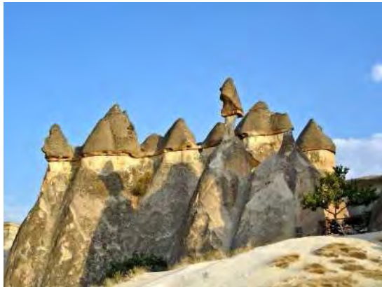
Cappadocia: camini di fata