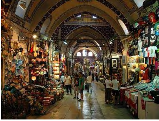
Istanbul: Gran Bazar