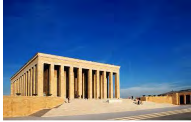
Ankara: Mausoleo di Ataturk