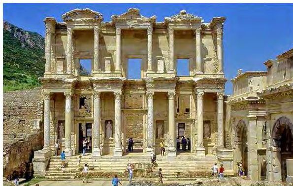
Efeso: biblioteca di Celso