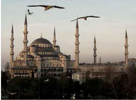
Istambul: Moschea Blu