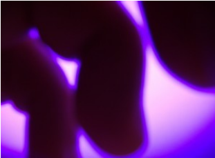
still dal video "New Identity"

"La ricerca di una nuova identità del singolo individuo all'interno della società che corre, che scappa e si evolve, è l'obbiettivo primario per ridefinire se stessi."