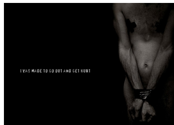
"I Was Made To Go Out And Get Hurt"

"Conferire al quotidiano realtà diverse, inaspettate, scomode. Descrivere solo cose a cui si è emotivamente legati. Né manifesti, né proclamati. Guardare la verità attraverso vetri sporchi. Malizia? Forse. In eterna lotta con la claustrofobia emotiva. Protagonista di una scena, senza una parte. Se questa non è arte, peggio per l'arte."