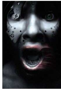
"What Else Is There?"

"... un disagio che è disadattamento e che sceglie artificio e natura per parlare ... contenuti strappati alla quotidianità, snaturati, combinati, fusi in forme strazianti, oggetto di metamorfosi fantastiche, protagonisti di ambientazioni oniriche e surreali. Chi guarda si mette in ascolto, come in attesa di un suono, sarà musica o parola o un grido? Il visitatore saprà scorgere l'umorismo celato dietro l'angoscia?"