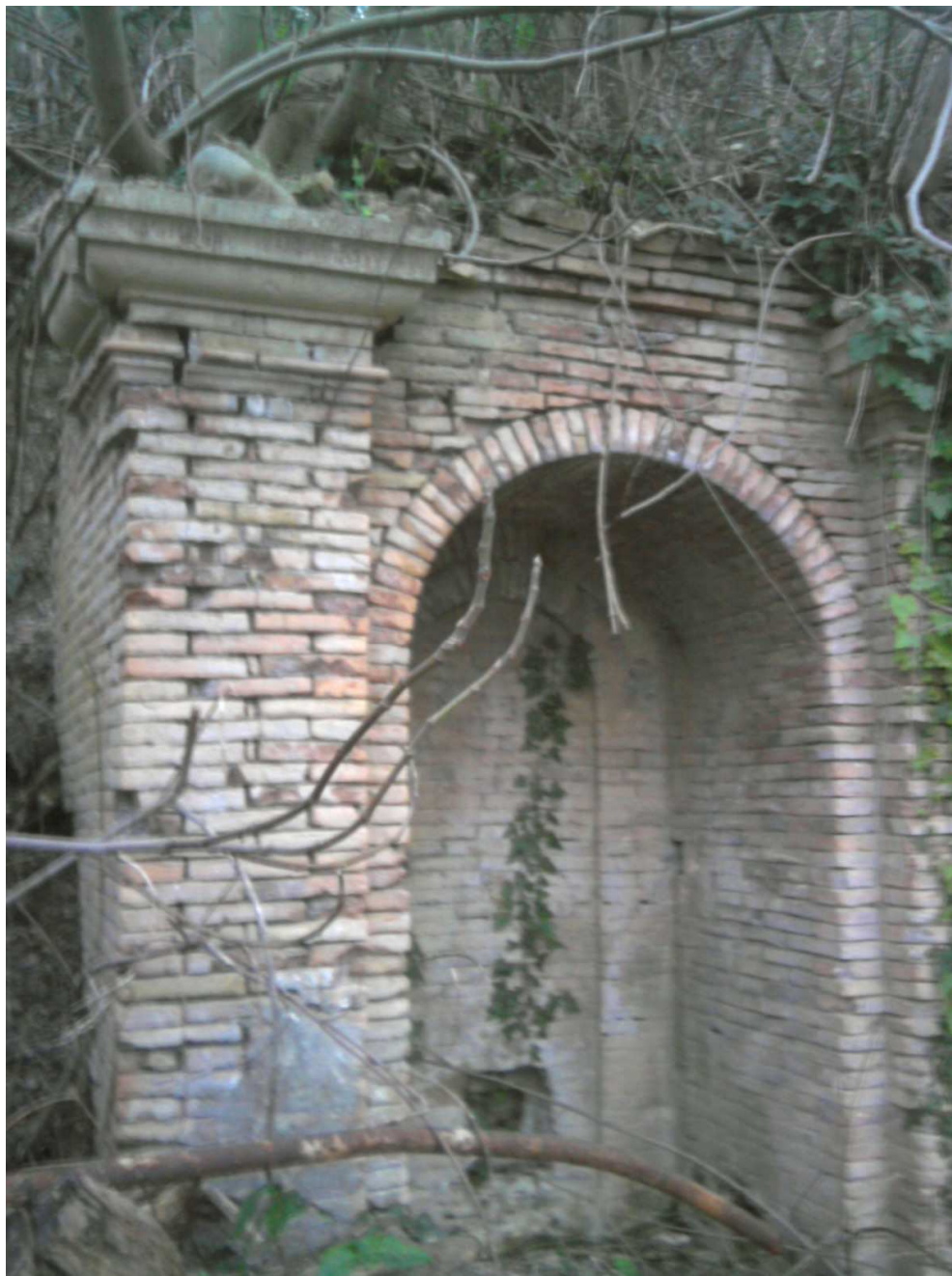
Figura 5 - Fonte murata, dettaglio arco sinistro