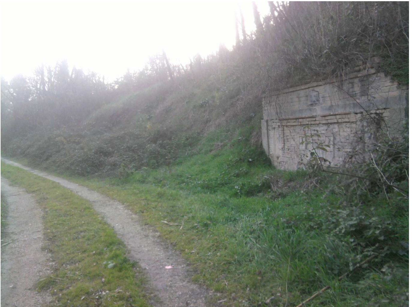
Figura 2 - fonte "vall isc", panoramica