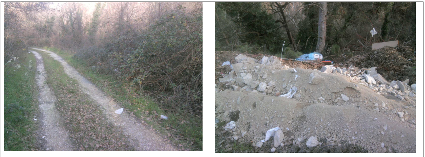
Figura 3 - strada di accesso e rifiuti abbandonati