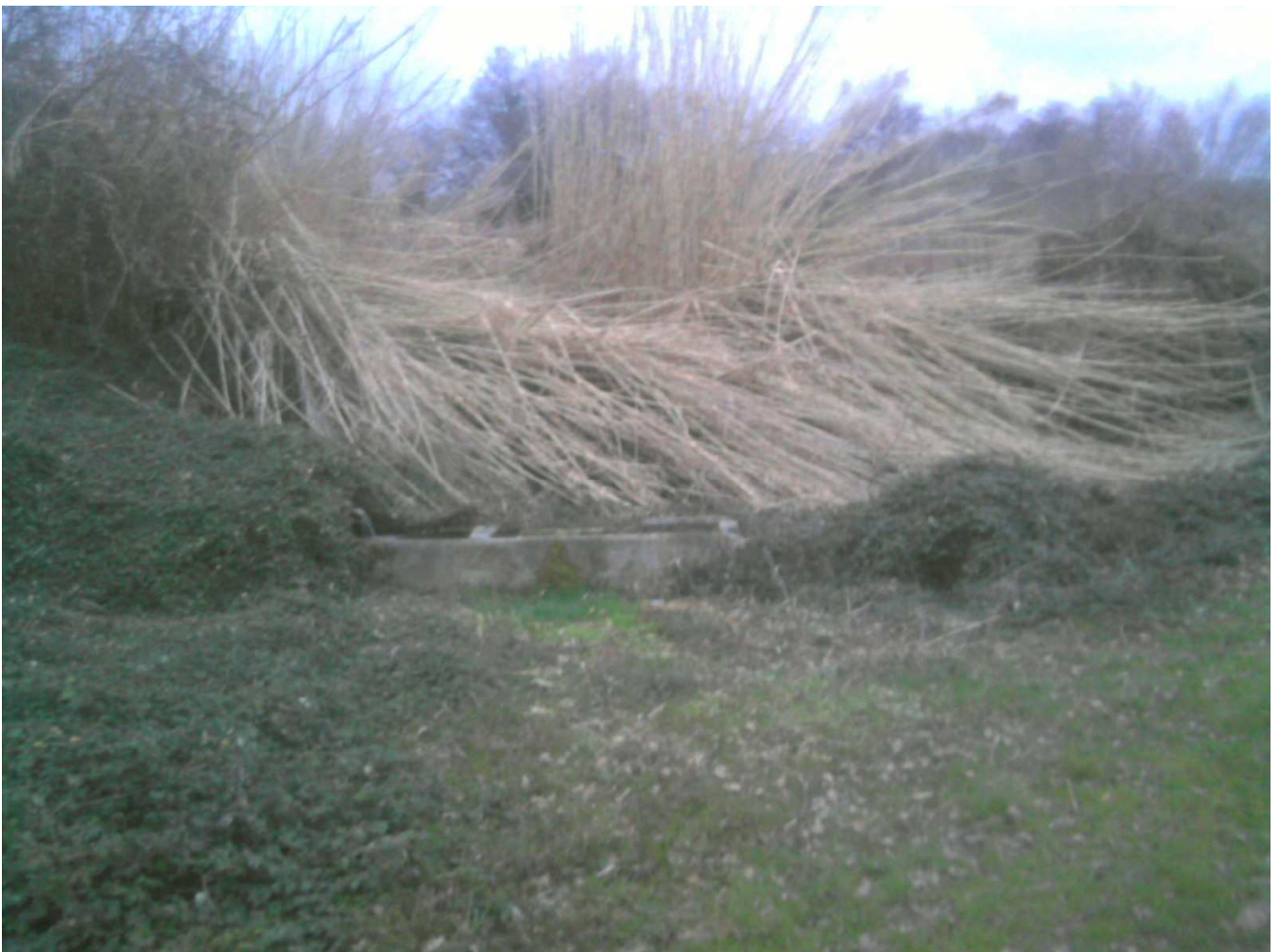
Figura 6 - Fonte Riccione

La portata è abbondante e genera addirittura un piccolo fossato. La morfologia del luogo consente di realizzare un'area attrezzata e presenta diversi sentieri percorribili a piedi o i mountain bike.