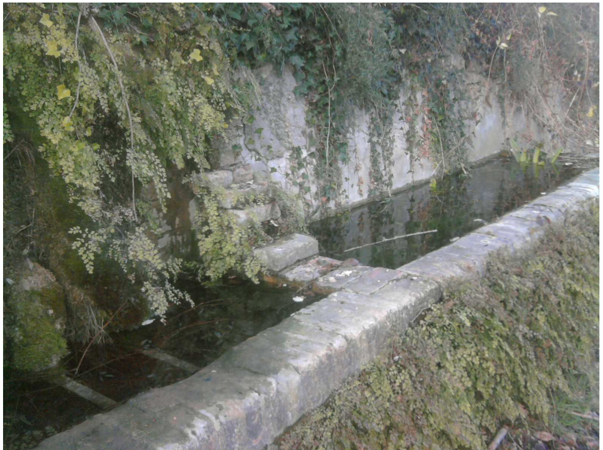
Figura 9 - Fonte San Michele, dettaglio vasche