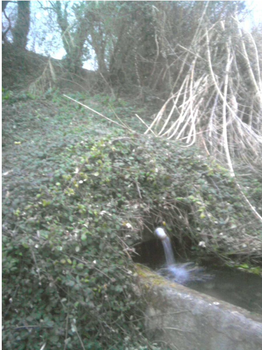
Figura 7 - Fonte Riccione, dettaglio vasca