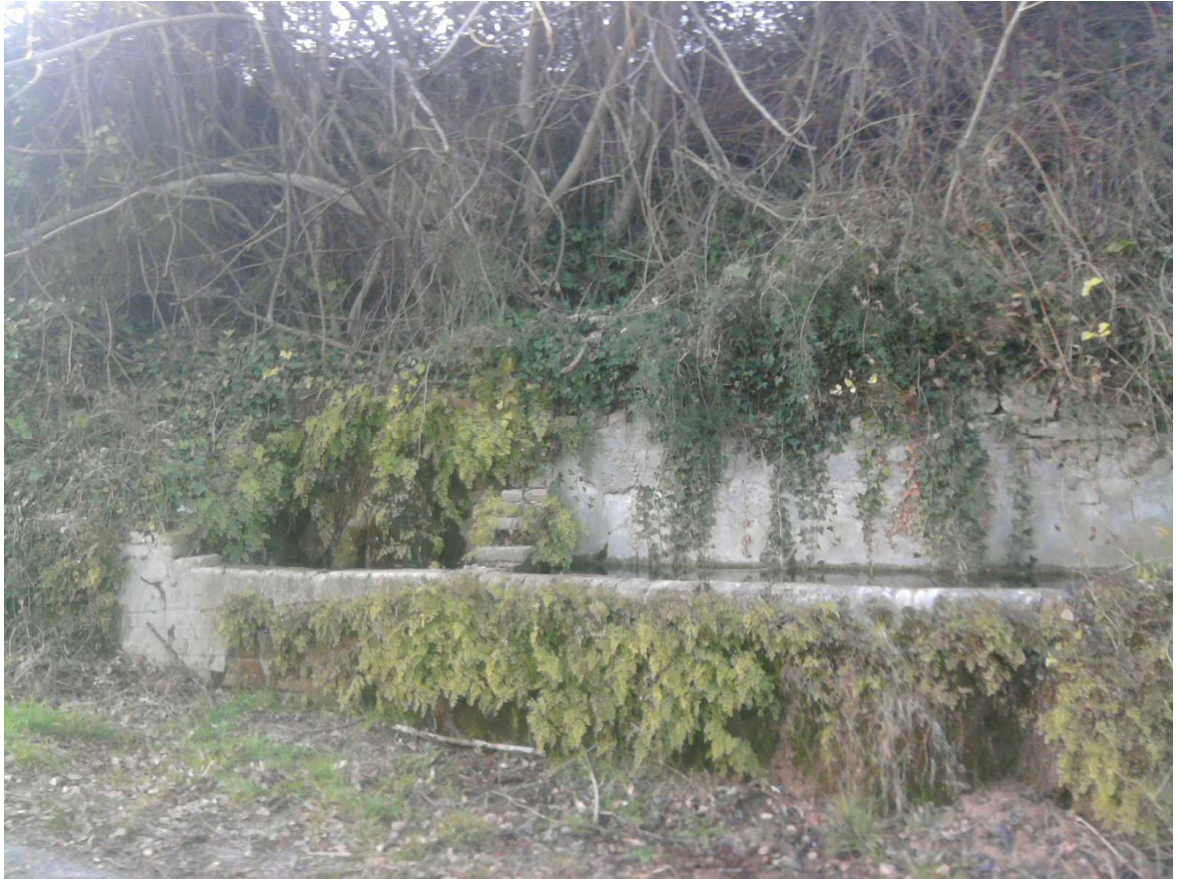
Figura 8 - Fonte San Michele