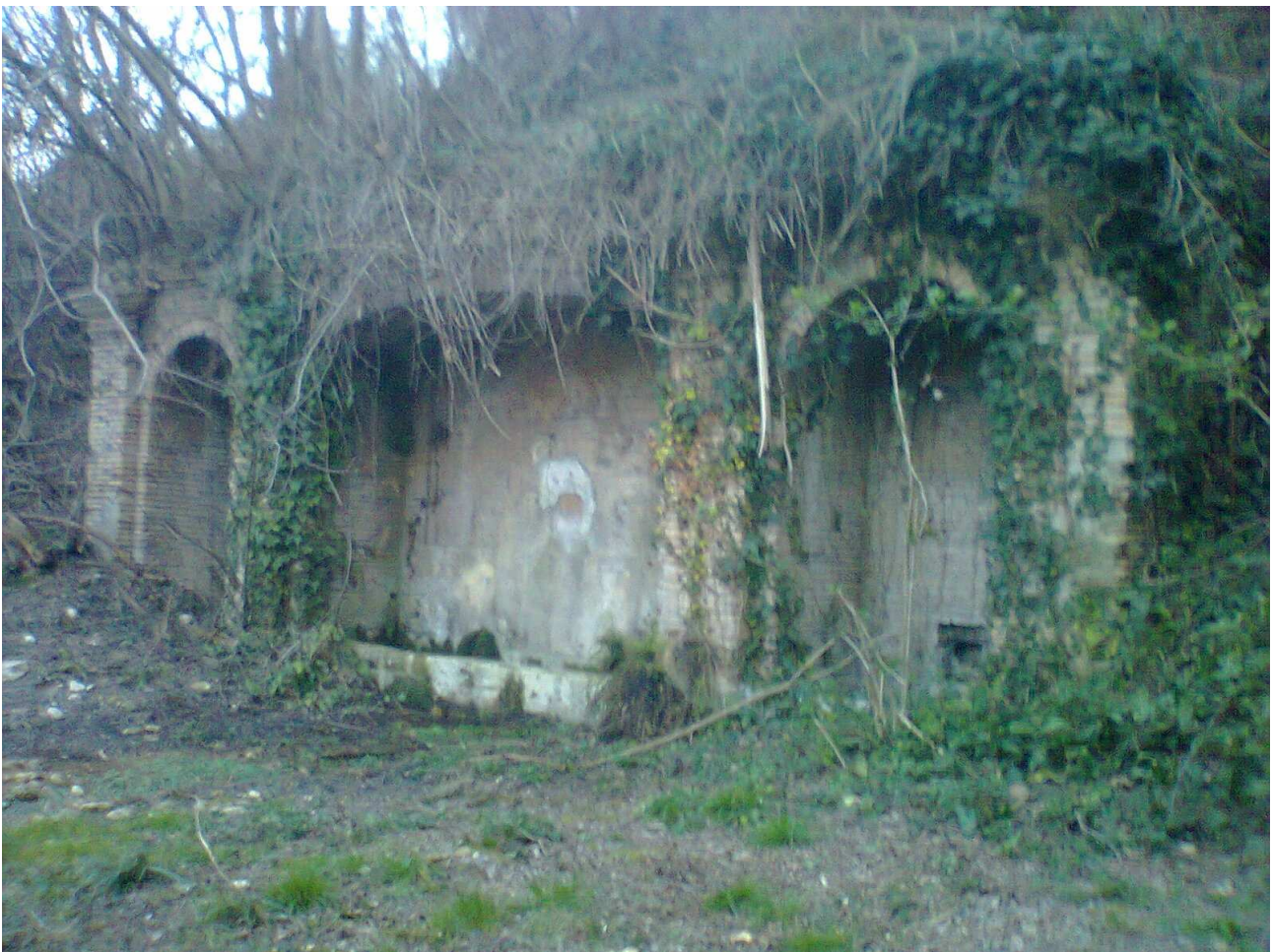
Figura 4 - Fonte Murata

L'area antistante la fontana è piuttosto ampia e si presta alla realizzazione di un'area attrezzata, inoltre in zona sono presenti numerose e pittoresche strade rurali che collegano le contrade della zona, una di queste si inoltra nel bosco e conduce ad un'altra fontana, conosciuta come “fonte di lebbri”.