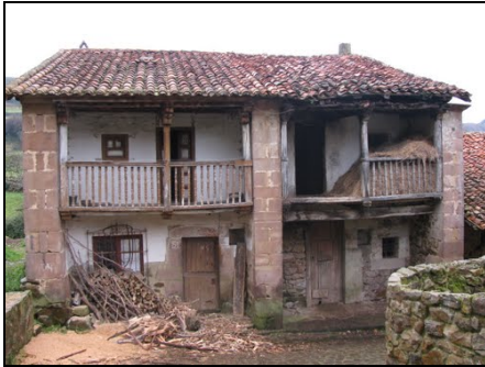
La casa de Mari Loli

Gente de todas clases sociales fueron testigos de los acontecimientos de Garabandal: sacerdotes, canónigos y teólogos, miembros de la familia real española, médicos, abogados, como los más humildes campesinos, se cuentan entre los miles de privilegiados que vieron a las cuatro niñas en éxtasis. La mayor parte quedó profundamente conmovida por lo que vió y se fue de allí convencida de la autenticidad de las apariciones. Un conocido pediatra declaró que las niñas eran siempre perfectamente normales y que los éxtasis no se explicaban con ningún