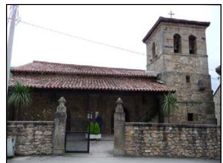
La iglesia de Garabandal

Las apariciones de Garabandal no han sido aprobadas ni tampoco desmentidas oficialmente por la Iglesia; siguen aún “ sub judice ” (bajo investigación).