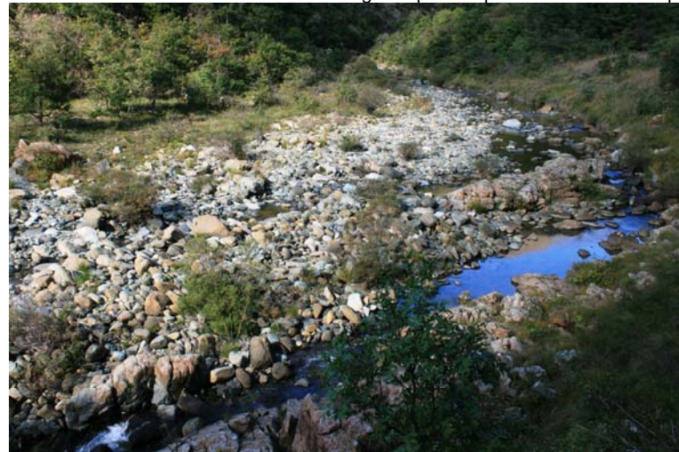
Scorcio del torrente Gorzente