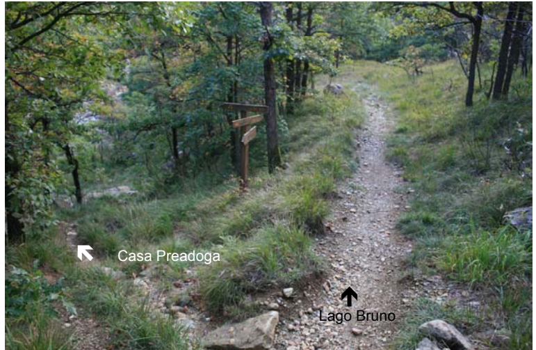
← Casa Preadoga