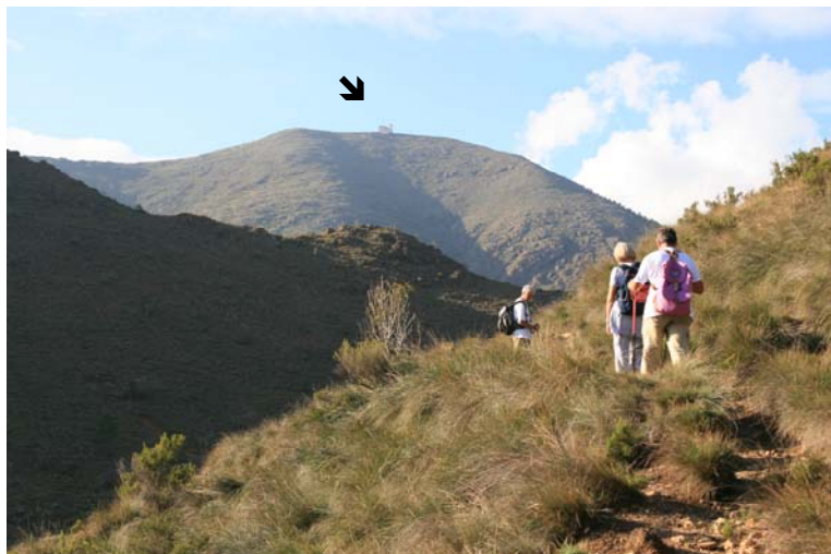
Sulla cresta la chiesetta del Tobbio