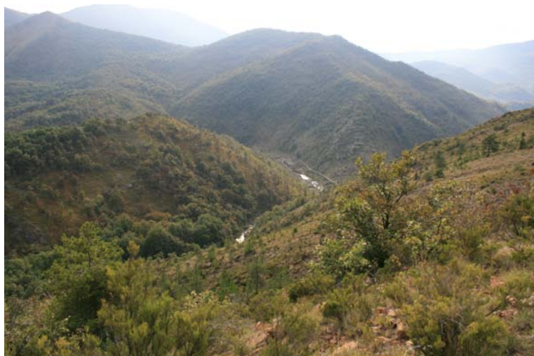
Panorama sul fondo valle, salendo verso casa Carossina