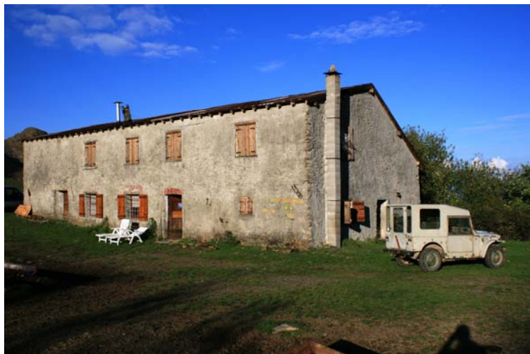
Casa Carossina (834 m), dopo circa 1h15m (da Preadoga)