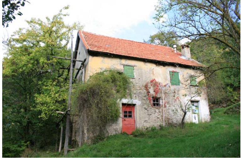
... in 5 minuti si arriva a Case Preadoga (588 m)