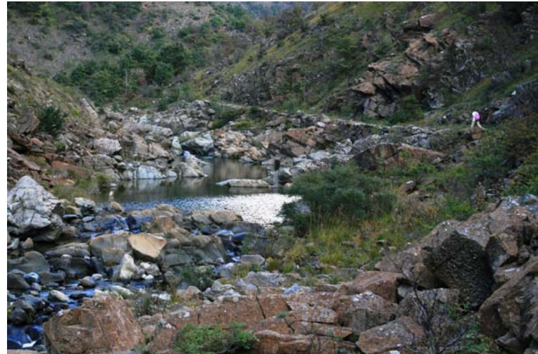
Il sentiero, quasi in piano, dopo una zona prativa (fonte) costeggia il torrente...