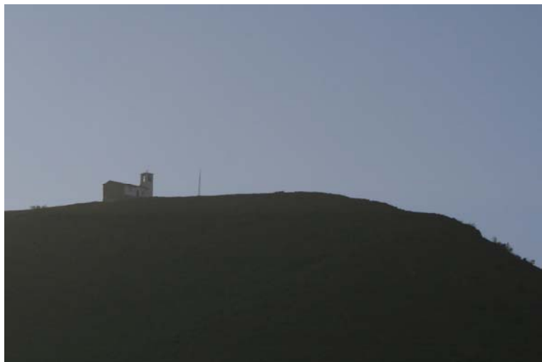
Particolare della vetta del Tobbio, con in evidenza la chiesetta