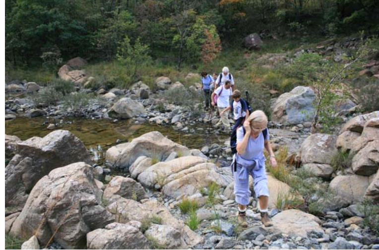
Si seguono i tre punti gialli e subito si guarda il torrente e si risale a sn nel bosco...