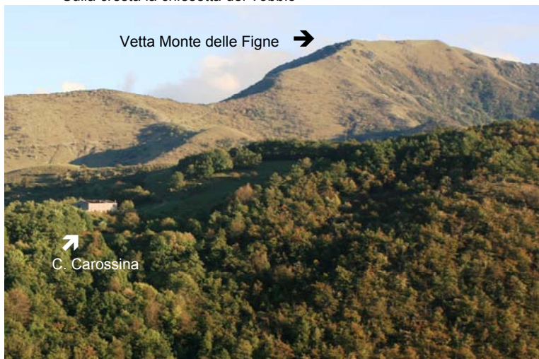
Casa Carossina camminando verso il Passo Dagliola (monte Figne in alto a dx)