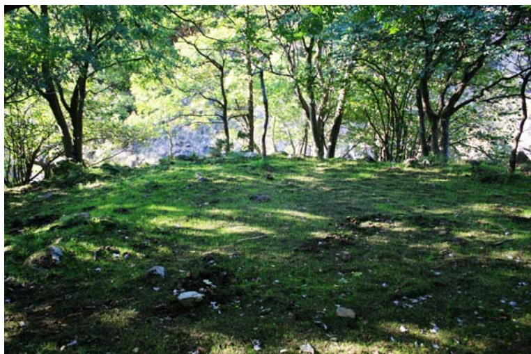
Piccolo prato in mezzo ad un boschetto...