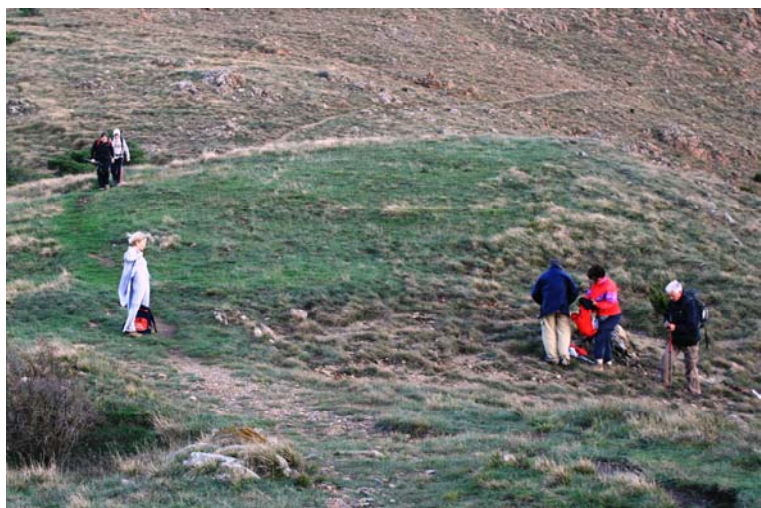
Zona molto ventosa... da cui si ridiscende verso il ponte Nespolo, distante circa 1h30, con i due rombi gialli (ultimo tratto su sterrato e asfalto... quasi al buio...) In tutto circa 4h (soste escluse), diff. E. Per salire fino al Tobbio era necessario avere disponibile almeno ancora 1h15m (andata e ritorno) più la pausa in vetta.