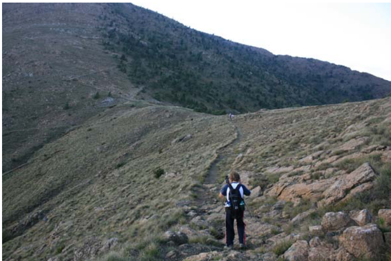
Arrivando al Passo Dagliola (856 m) in circa 25' (approccio finale per il Tobbio, ma oggi è molto tardi, quindi non si va verso la vetta)