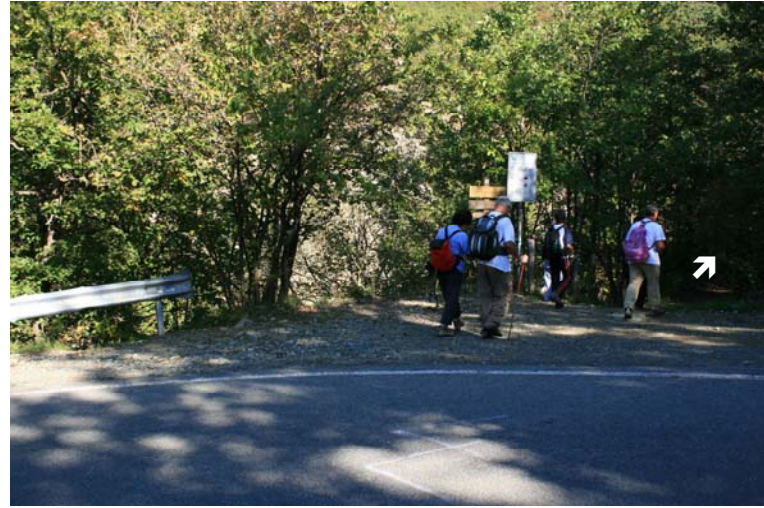
Curva (507 m) da cui parte sentiero per lago Bruno e monte Tobbio (linea punto giallo), parcheggio lungo i bordi strada o da Guado Gorzente. Si è sulla carrozzabile che dai Piani di Praglia supera Capanne di Marcarolo e poi prosegue verso il valico degli Eremiti e Voltaggio.