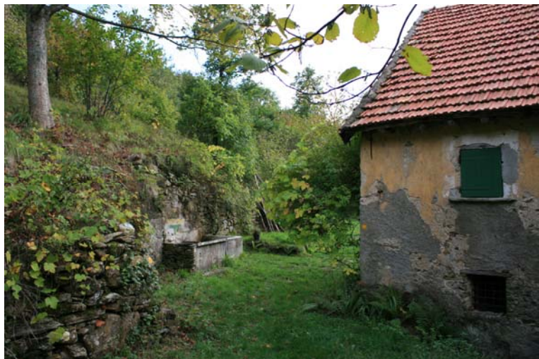
Scorcio da case Preadoga