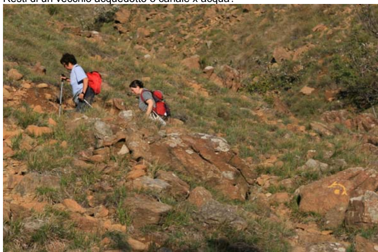
Ci sono dei saliscendi (attraversando alcuni ruscelli) e si superano dei tornanti verso il crinale