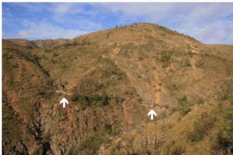
Resti di un vecchio acquedotto o canale x acqua?