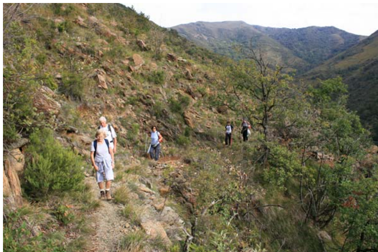
si sale ora (direzione Tobbio sul quadrato giallo)