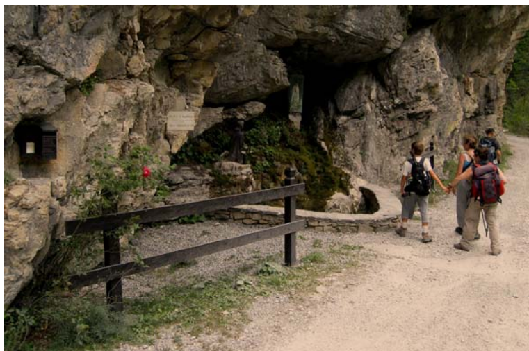
Riparo religioso per l'anno Mariano 1987/88