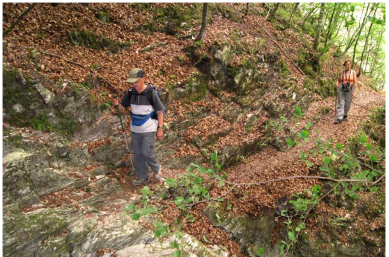
Freschissimo bosco di Faggi