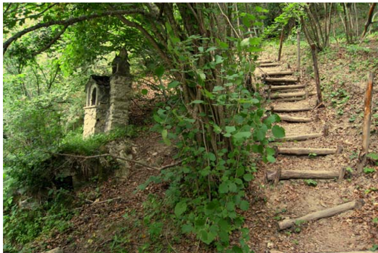
Salendo dal ponte Sciarante (dall'edicola sul tratto scalinato) all'Arma Cornarea