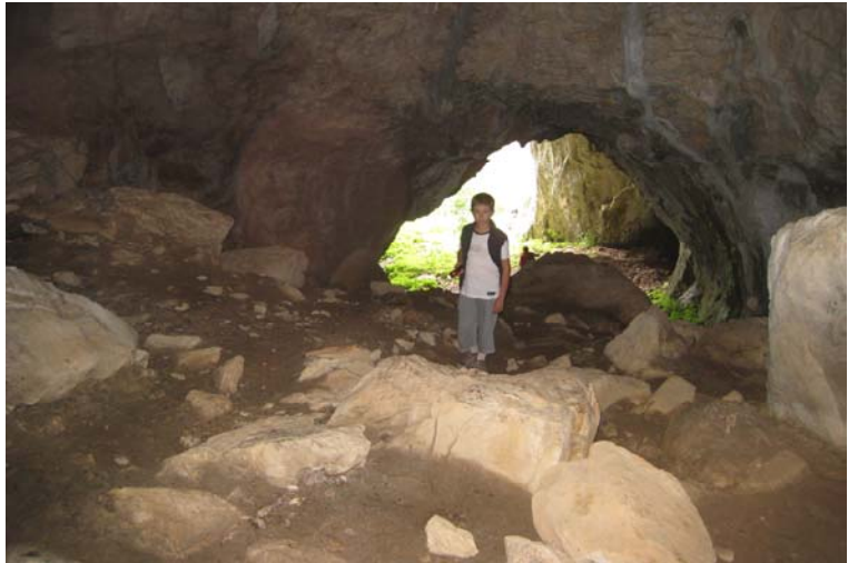
Accesso alla grotta