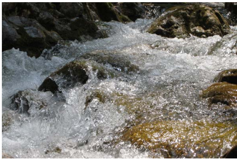
Giochi d'acqua del rio Tanarello