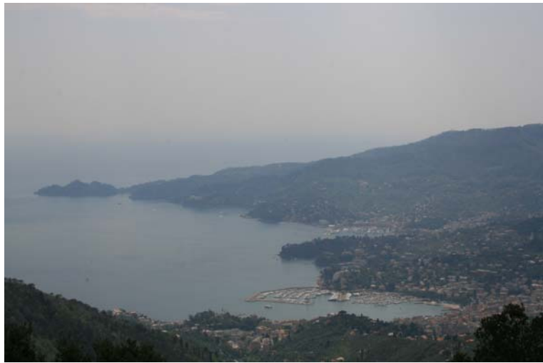
Panorama da Montallegro verso Rapallo , Santa Margherita e Portofino