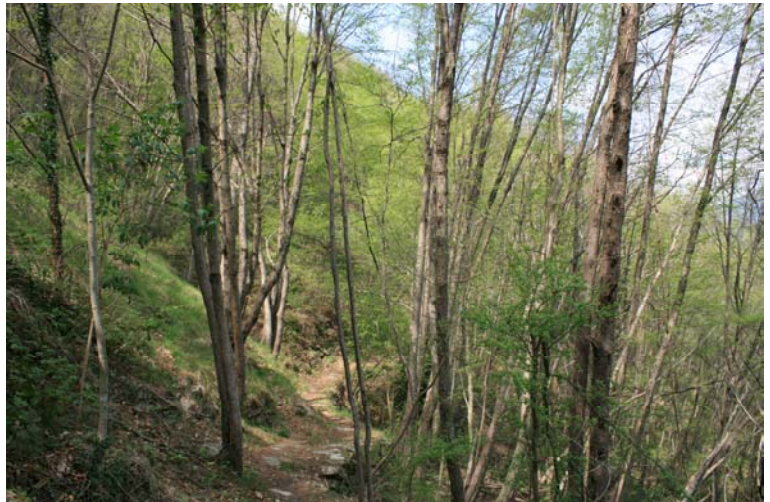
La discesa è lungo i due triangoli rossi (sentiero Chichizola) fino a Canevale (1h)