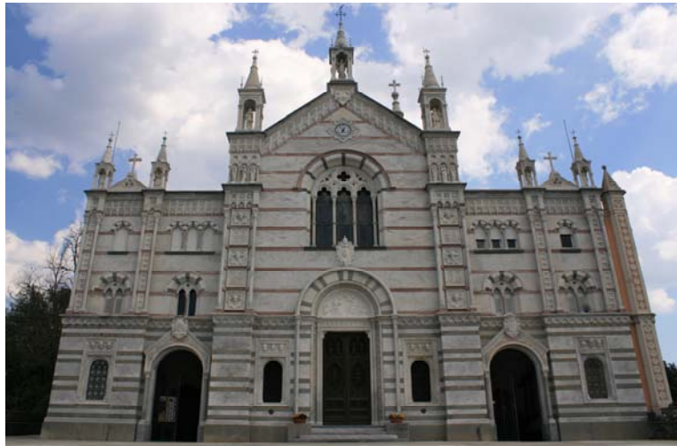
Il Santuario di Montallegro