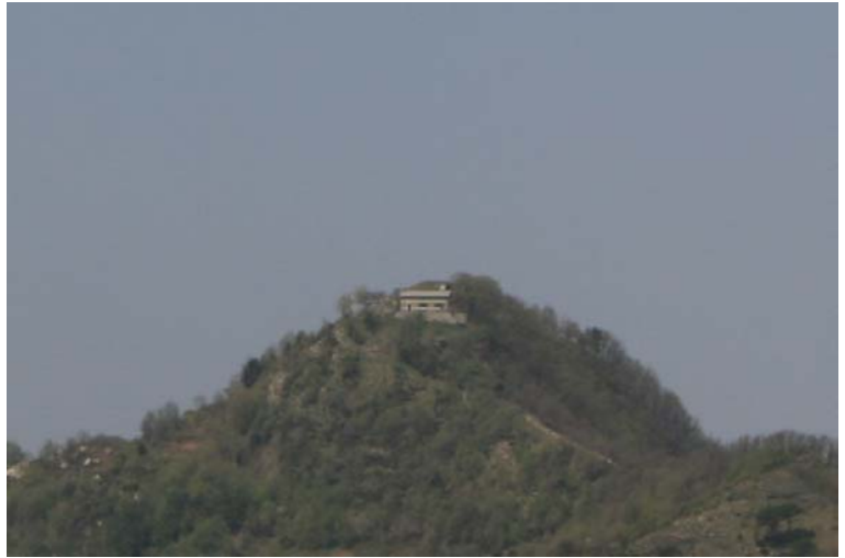
Il rifugio Margherita sul monte Pegge dal Santuario