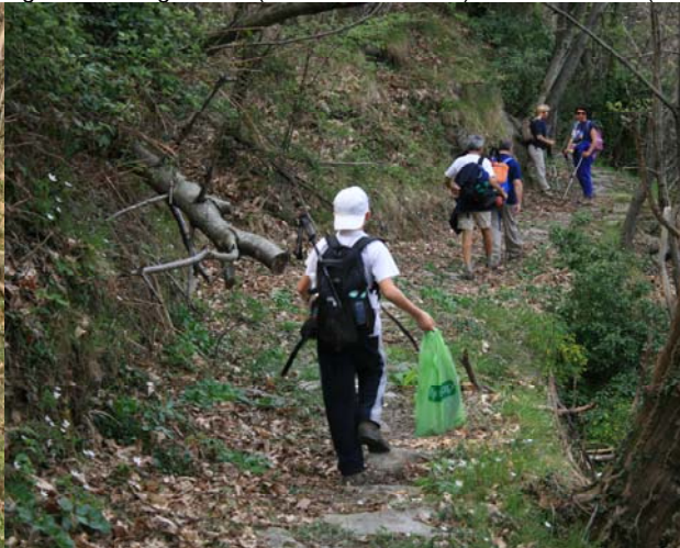
Dopo Canevale (nessun segnale) si scende su asfalto per i Piani di Coreglia, dove su strada secondaria si piega a sinistra per Pian dei Manzi, dove c'è l'auto(1h) 2