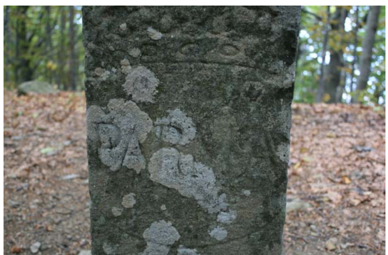
Cippo di confine tra il ducato di Parma e il regno Sabaudo (la croce è il simbolo della casa torinese) del 1826!