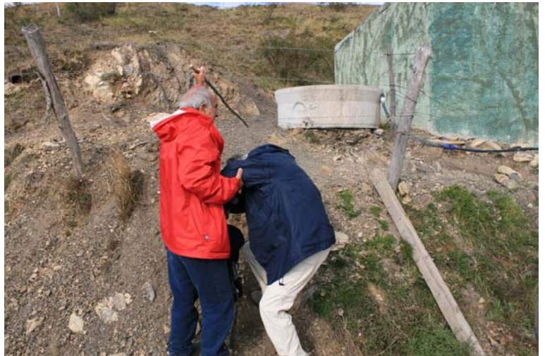
Ci si inventa una scorciatoia con annesso passaggio difficoltoso... perché se no finiva che la gita era troppo semplice....