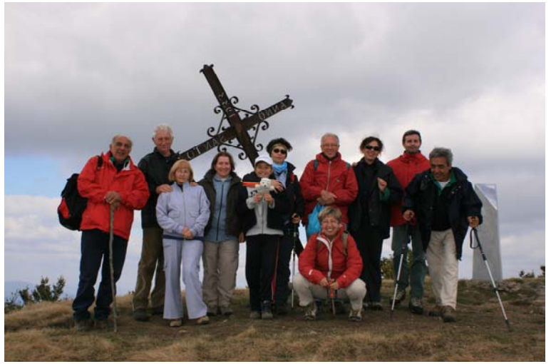
Foto di parte del gruppo in vetta dalla croce dell'anno santo del 1933 piegata dal tempo e dai fulmini