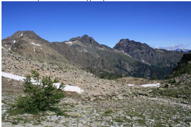
La vista è stupenda (dal passo risalire per una decina di metri, a sinistra, fino a un piccolissimo spiano) e spazia da...