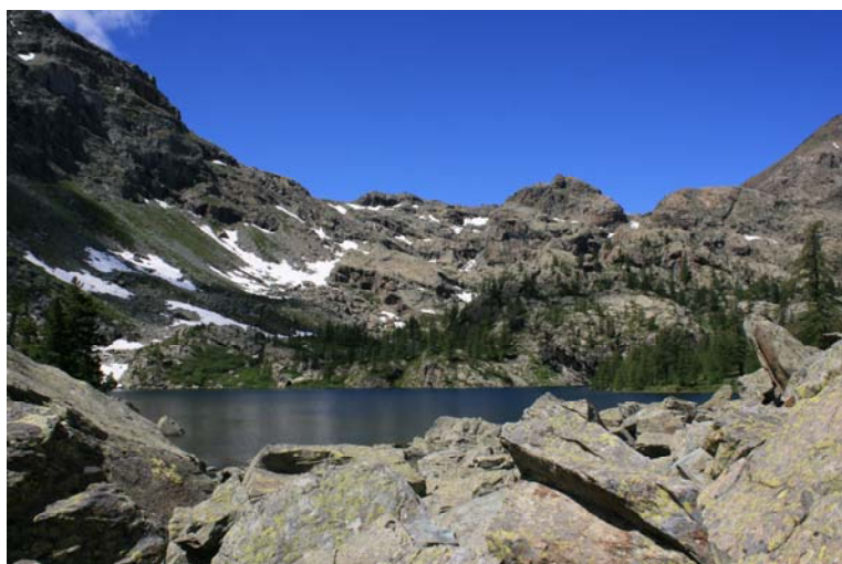
Lac Cornu (2168) che si raggiunge piegando a sinistra su sentiero non segnato... tra sfasciumi e qualche ometto di pietra...