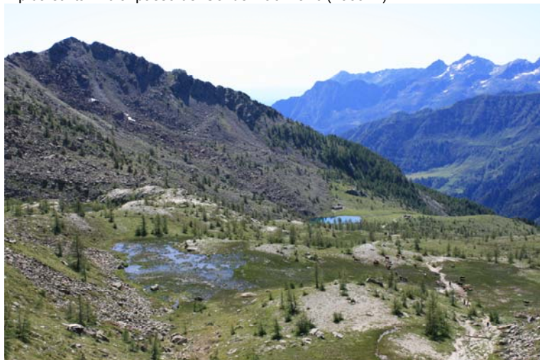
Zona umida e più in basso il lago Muffè dal Col del Lac Blanc