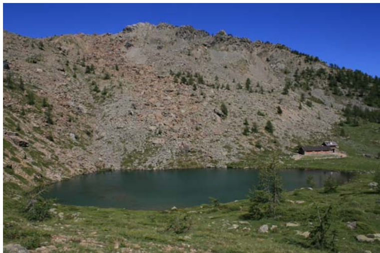
Il lago Muffè 2076 m