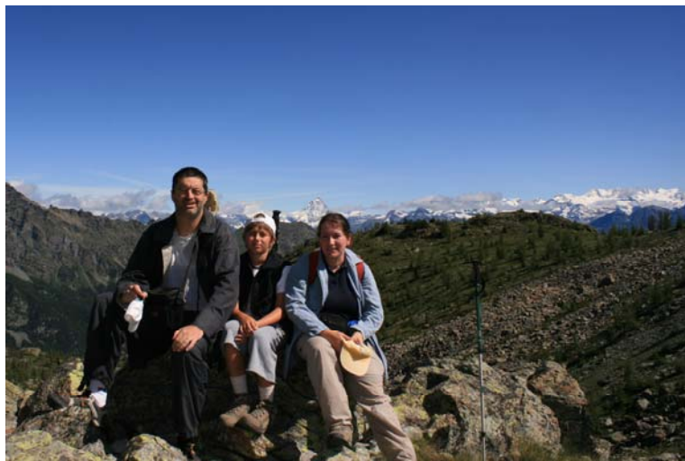
Foto di gruppo con lo sfondo dal Cervino al gruppo del Rosa....