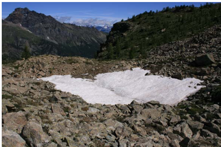
Consistente lingua di neve...