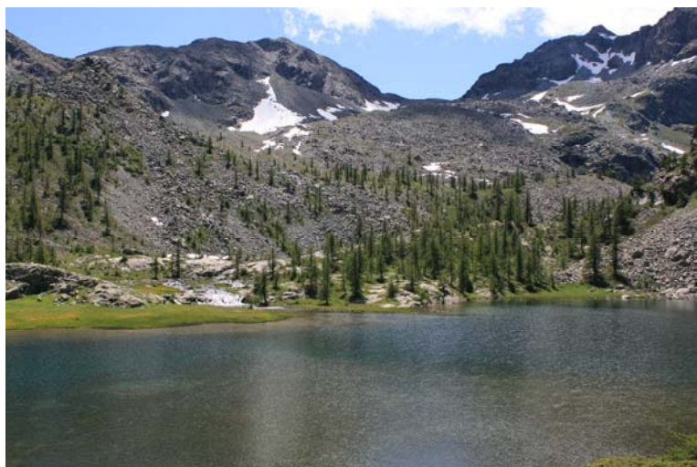
Ancora il Lac Blanc