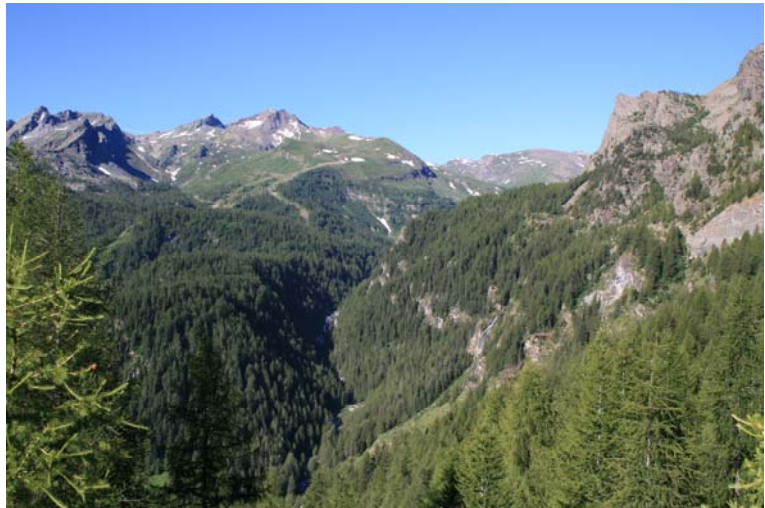
Vista dalla partenza alla fine dell'asfalto a circa 1750 m