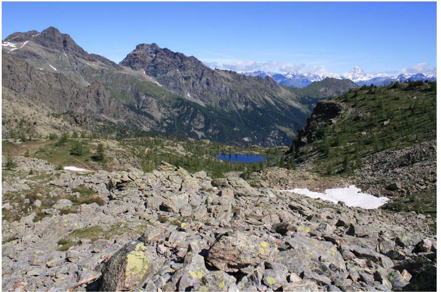
Il lago Vallette in uno scenario indescrivibile ...