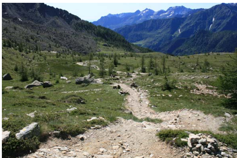
Retrospectiva sul sentiero appena percorso