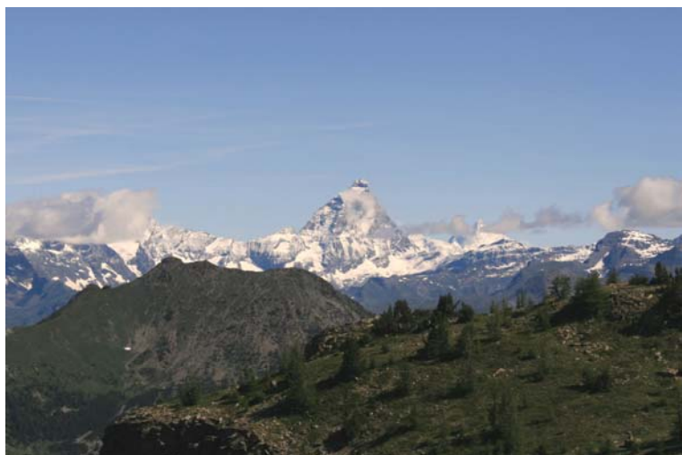
.. sua maestà il Cervino al...