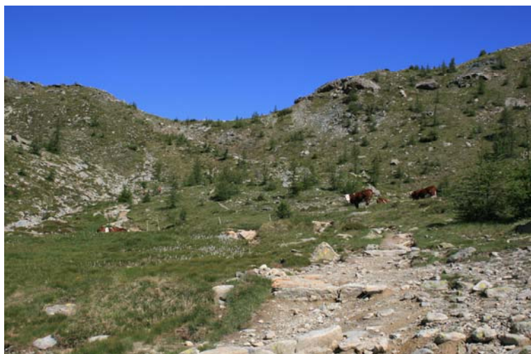
Ripida salita fino al passo del Col del Lac Blanc (2309 m)