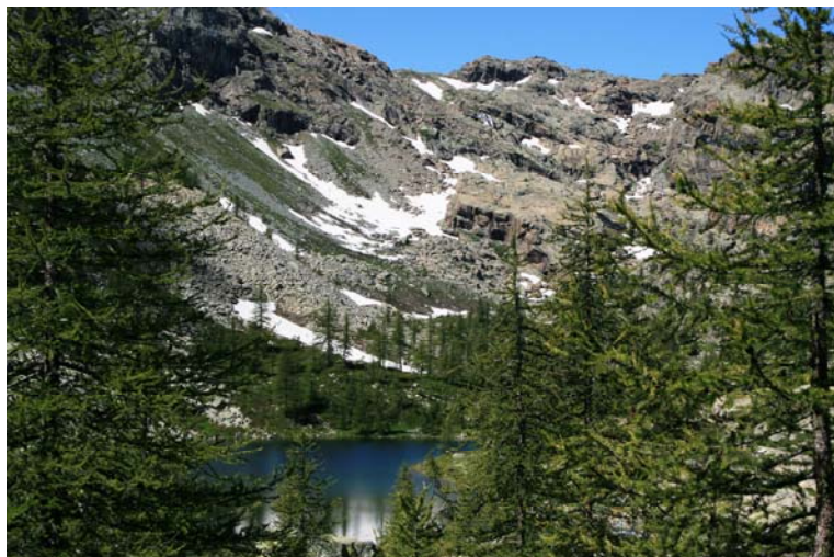
Lac Noir (2166 m)