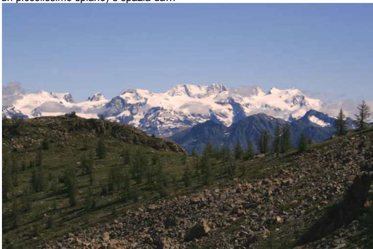
... l'imponente gruppo del Rosa... Fantastic!!!!