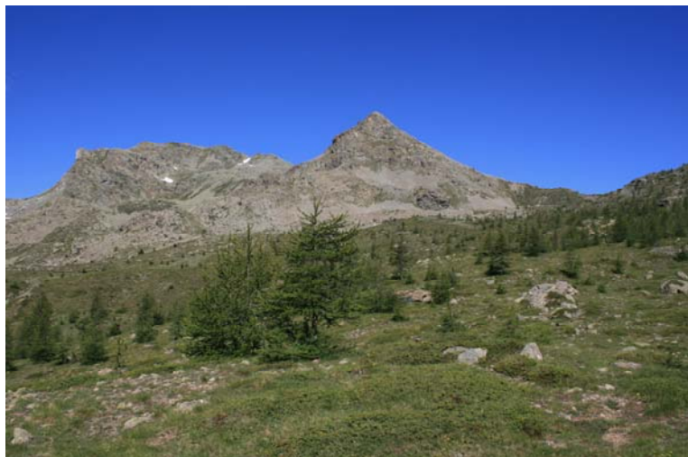
Salendo al Col del Lac Blanc con la caratteristica punta del monte Torretta (2538 m)