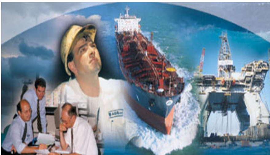
Fig. 1 Gestione della sicurezza.

- Registro Italiano Navale (RINA) : funge da ente tecnico del ministero ed ha il compito effettuare le ispezioni e le verifiche richieste dalle normative, nonché rilasciare le relative certificazioni.