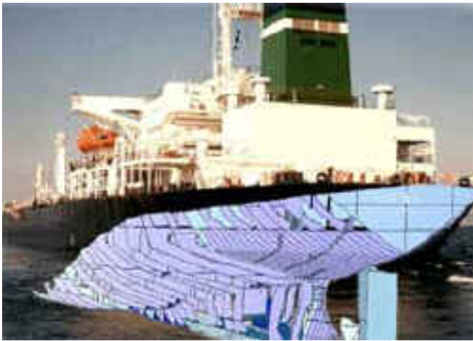
Fig. 2 Il trasporto via mare.

Comitati Permanenti e Sottocomitati svolgono gran parte del lavoro a carattere tecnico/giuridico, e sono aperti alla