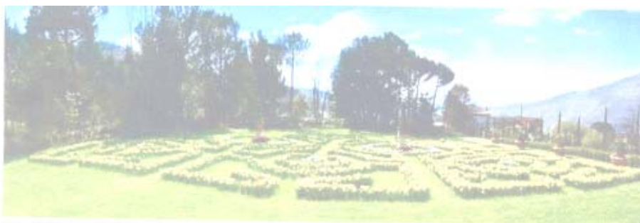
Villa "La Pescigola" - Il labirinto

Come nella fiaba della Bella addormentata, il giardino della Villa La Pescigola è stato risvegliato dopo anni di abbandono.