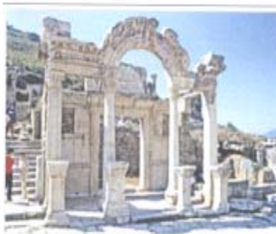
Efeso - Tempio di Adriano

romano di tutta l'Asia Minore. Visita dell' Agorà , della via sacra , del Tempio di Adriano , della famosa biblioteca che era la terza più grande del mondo antico; del teatro , che è il più grande di tutta l'Asia Minore, della chiesa della Vergine Maria , che fu la sede del terzo Concilio Ecumenico e della Casa della Madonna dove essa visse un'ultima parte della sua vita, riconosciuta dalla tradizione.