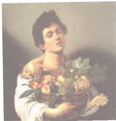
Michelangelo da Caravaggio - Il ragazzo con il canestro di frutta

Il ragazzo con il canestro di frutta (1593-1594). Nell'esecuzione di questa tela è spiegata tutta la giovanile cultura lombarda del pittore. La cura nell'espore i dettagli, quali la foglia ingiallita in procinto di cadere, la spaccatura sanguigna del fico maturo o la butteratura delle foglie a stelo, corrisponde alla prima formazione lombarda del Caravaggio, dove il naturalismo scientifico leonardesco aveva sortito precoci affondi nella rappresentazione di elementi propri della natura morta che in ambi-