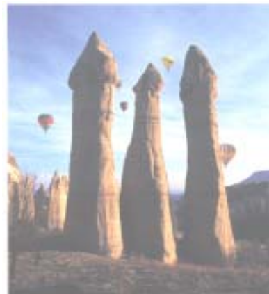
Cappadocia - I camini delle fate

6° giorno – venerdì 8 maggio – CAPPADOCIA/PAMUKKALE