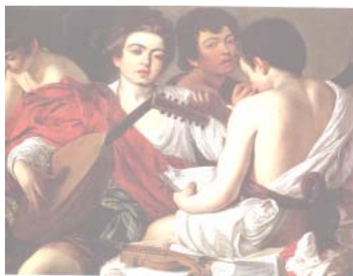
Michelangelo da Caravaggio - I musicisti (particolare)

I Musicisti (1595). Il quadro rappresenta una complessa allegoria pagana, sicuramente dettata all'ar-