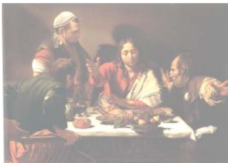
Michelangelo Merisi da Caravaggio - Cena in Emmaus (National Gallery, Londra)