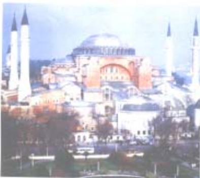
Istanbul - Basilica di Santa Sofia

Intera giornata dedicata alla scoperta della città; visita dell' Ippodromo Romano ; della Moschea Blu che è l'unica moschea reale con sei minareti; visita della grandiosa Basilica di S. Sofia , costruita nel VI secolo