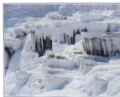
Pamukkale - Le cascate pietrificate

In mattinata visita di Hierapolis , della Necropoli , dell' Agorà , del teatro , del martirium di S. Filippo e delle famose cascate pietrificate : un paesaggio spettacolare formato dalle sorgenti di acque calde che venivano utilizzate per le cure termali.