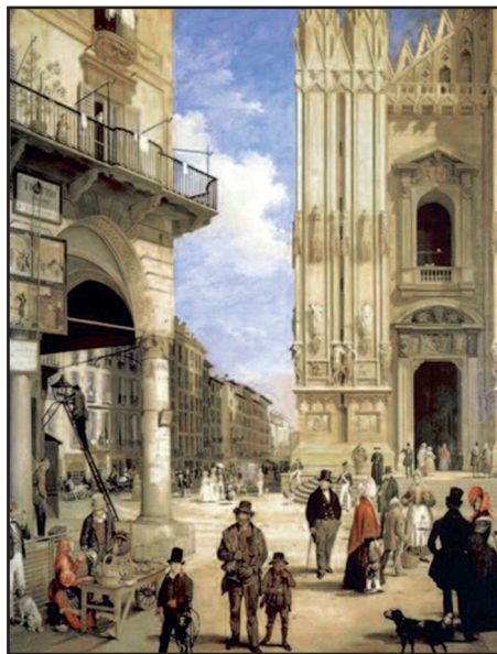
Angelo Inganni, Veduta di piazza Duomo e del coperto dei Figini, 1838, Milano, Civiche Raccolte Storiche di Palazzo Morando

Ore 21.30 La bellezza (della musica) salverà il mondo? Concerto in onore dei Convegnisti del Coro polifonico della Parrocchia dei Santi Patroni d'Italia [da confermare]