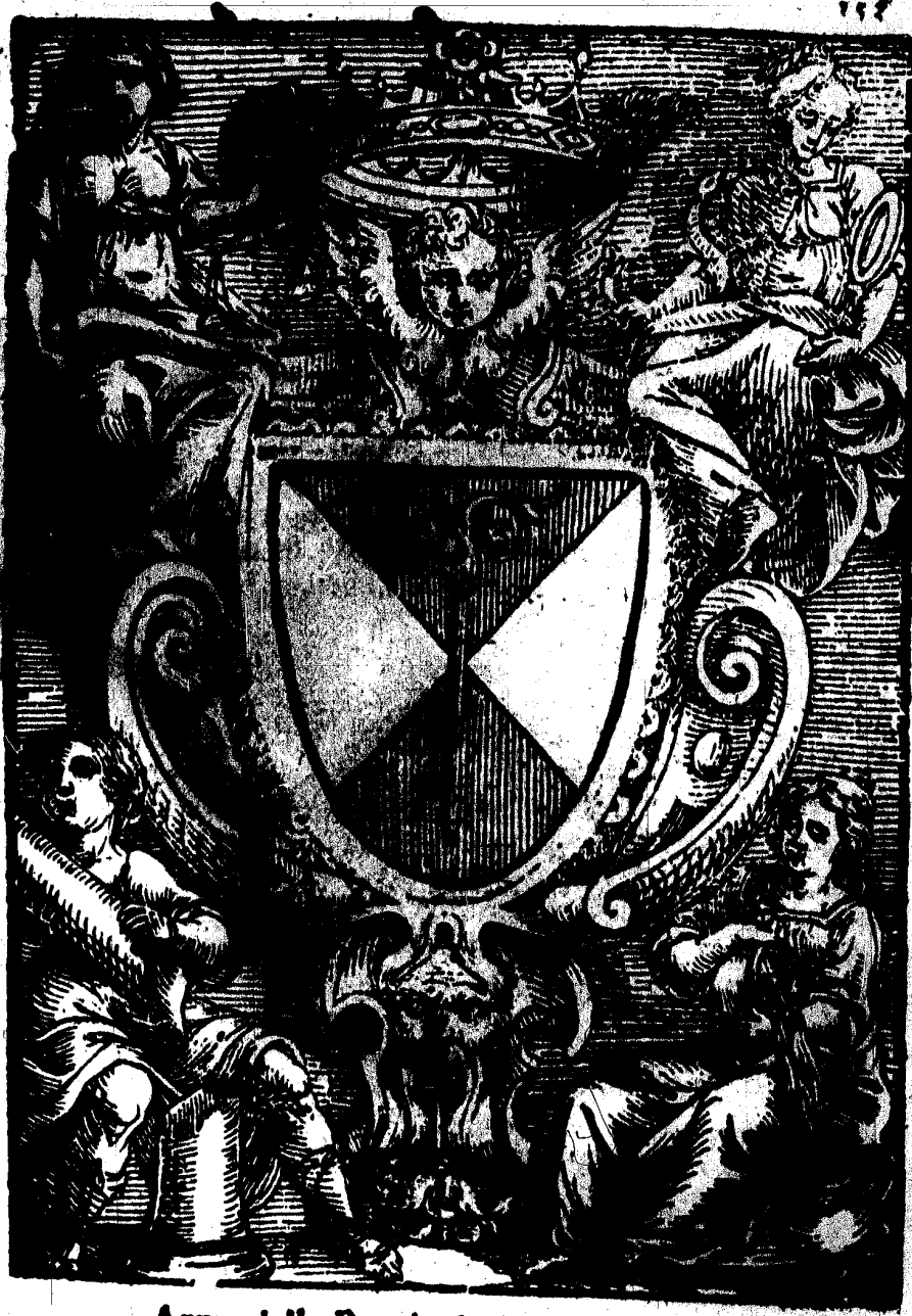
Arme della Prouincia di Terradi Bari.