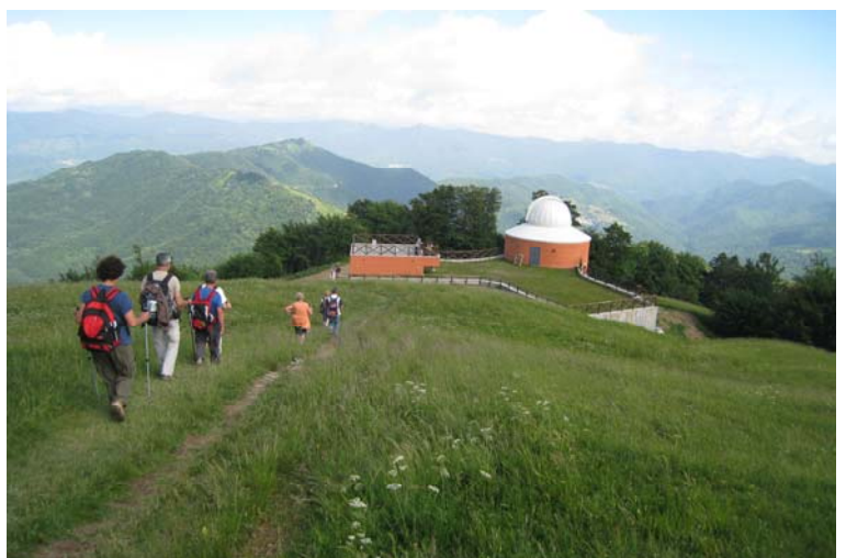
il nuovo osservatorio astronomico