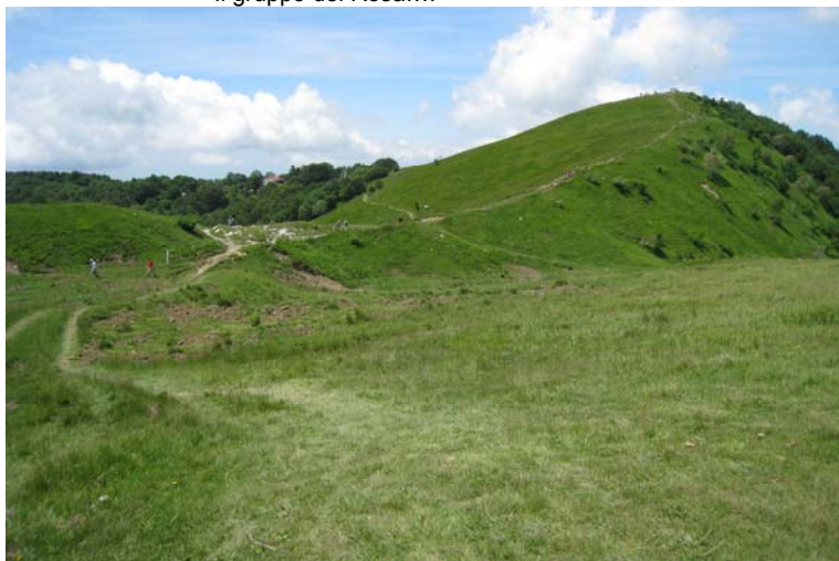
In vista della vetta