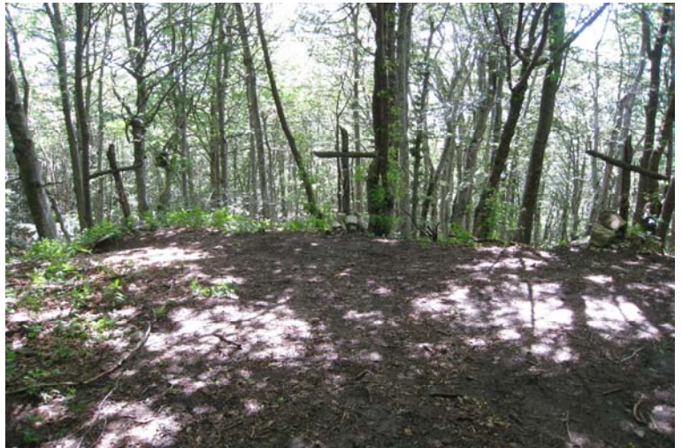
Le tre croci...