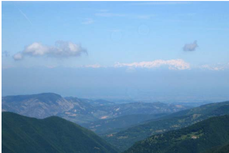
Il gruppo del Rosa...!