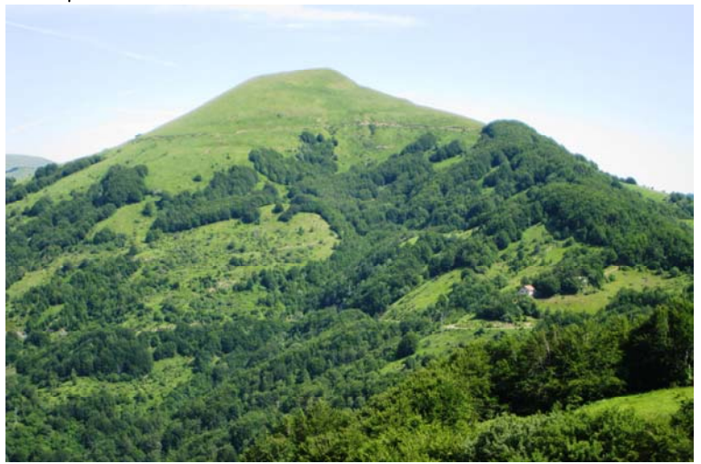
Il monte Carmo