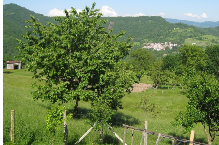
Carpeneto (900 m) da Rondanina ↑