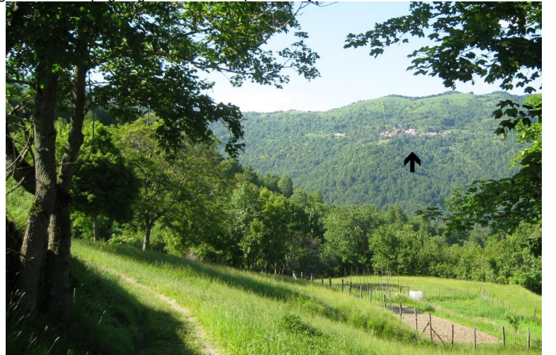
In lontananza, Fascia dal sentiero giallo usciti da Rondanina...