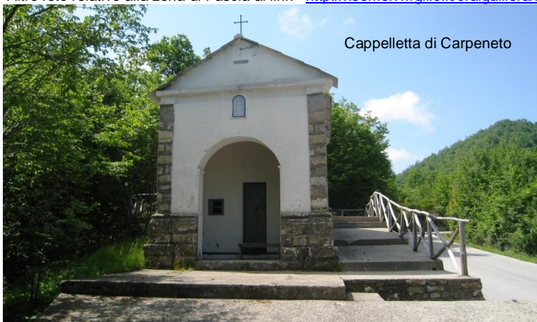
Cappelletta di Carpeneto

A Fascia dalla Osteria dei Lilli (tel. 010 95843 ) si mangia sempre benissimo a un prezzo basso... (65 Euro in tre, dall'antipasto al caffè... 2 adulti e un ragazzo...) Altre foto relative alla zona di Fascia ai link http://xoomer.virgilio.it/cralgalliera/fascia.htm e http://xoomer.virgilio.it/cralgalliera/fascia2006.pdf