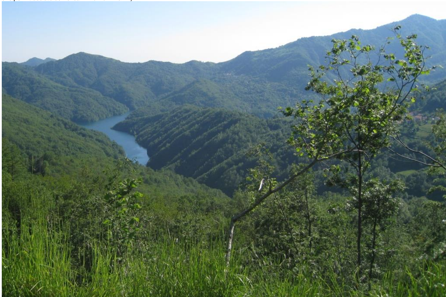
Il lago di Brugneto... sulla via di ritorno in auto...

Chiesa di Rondanina (1000 m), dove accanto c'è pure la canonica che è stata riadattata a rifugio (presente pure un piccolo museo...) Vicino la chiesa ci sono un paio di discese, non segnate che forse portano a Carpeneto... ma nessuna certezza... Alla fine l'unica convinzione è che, in sicurezza, si può fare solo Rondanina Fascia e ritorno con i simboli FIE (la percorrenza dovrebbe essere di circa 2h x tratta... ma ci sono saliscendi e quindi si può presumere che per il tracciato duri circa 4h A/R dif. Max E)