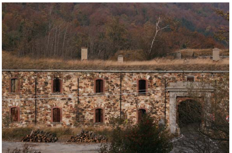
Quasi al bivio per il forte Tortagna

Accesso: uscita autostrada a Finale Ligure (A10); si gira a destra verso il Colle del Melogno, distante circa 15 km. Dopo aver sottopassato la porta della fortezza sul colle, si posteggia l'auto negli spiazzi, dove c'è un ristorante.