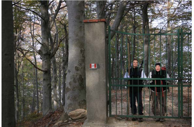
Cancello vicino al bivio in salita che porta ai ruderi del forte Merizzo