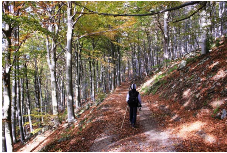
In tutto circa 350 mt di dislivello