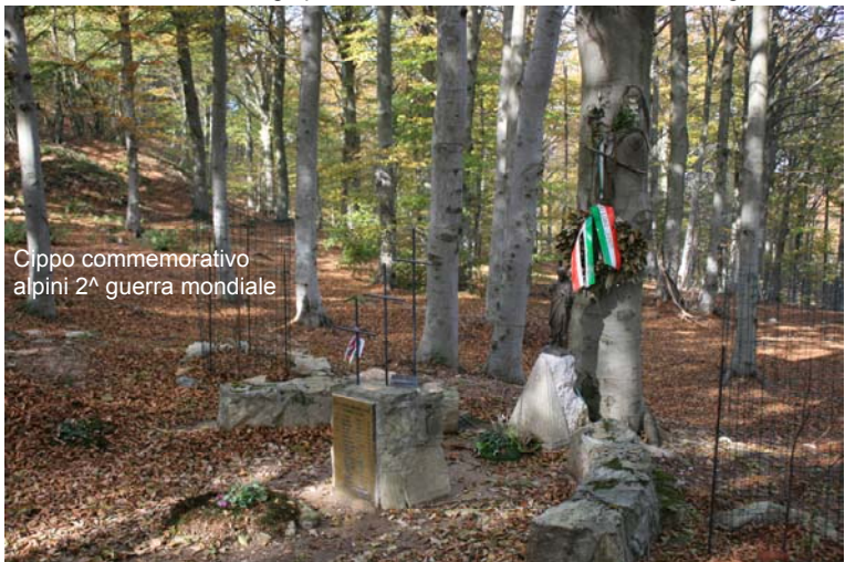
Cippo commemorativo alpini 2 a guerra mondiale

ci vuole una buona dose di esperienza e senso della giusta direzione... diff. EE - si confluisce su una larga pista e si arriva in oltre 1h dal forte Tortagna, chiuso!