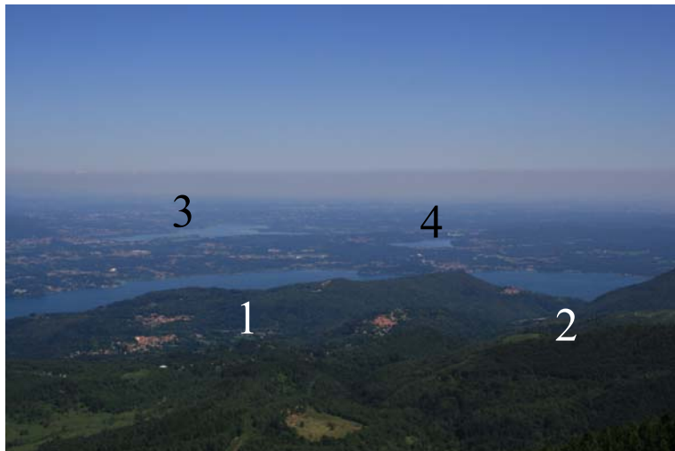
Sempre dal Mottarone: parte sud del Lago Maggiore (1 e 2), Lago di Varese (3) e Lago di Monate (4)