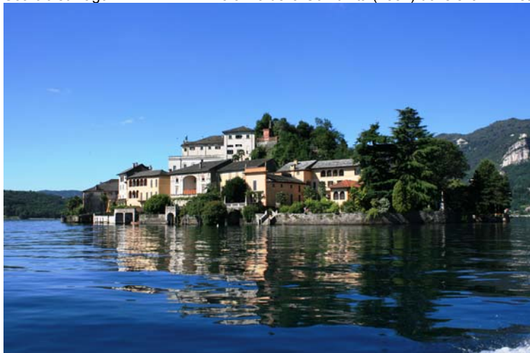
Isola di S. Giulio, con un perimetro di soli 650 m