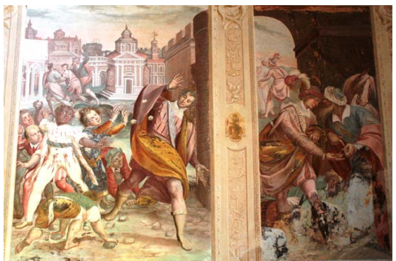
Altri momenti della vita di S. Francesco, attraverso i vari affreschi e le statue presenti nelle diverse cappelle che si incontrano lungo il percorso devozionale