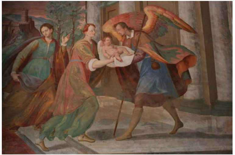
Il Sacro Monte di Orta progettato da Padre Cleto nel 1583 (20 cappelle realizzate fino al XVII secolo che raccontano la vita di S.Francesco) – La nascita