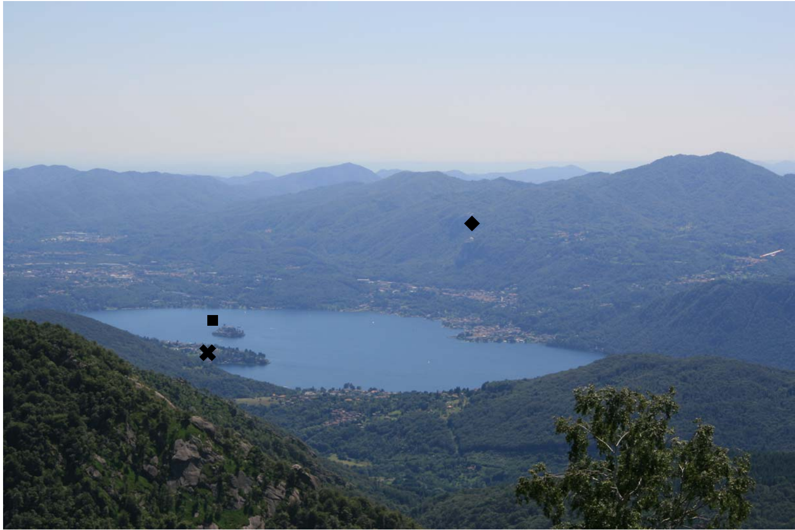
Vista del lago d'Orta, salendo verso il Mottarone (alto 1491 m - accesso in auto da Omega, Agrano e Armeno) Altra mappa generale lago d'Orta:

◆ Madonna del Sasso - ■ Isola di S.Giulio - ✕ Sacro Monte di Orta