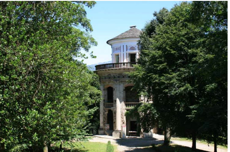
Il XXI a edificio, la Cappella Nuova, non terminato per l'editto Napoleonico del 1810