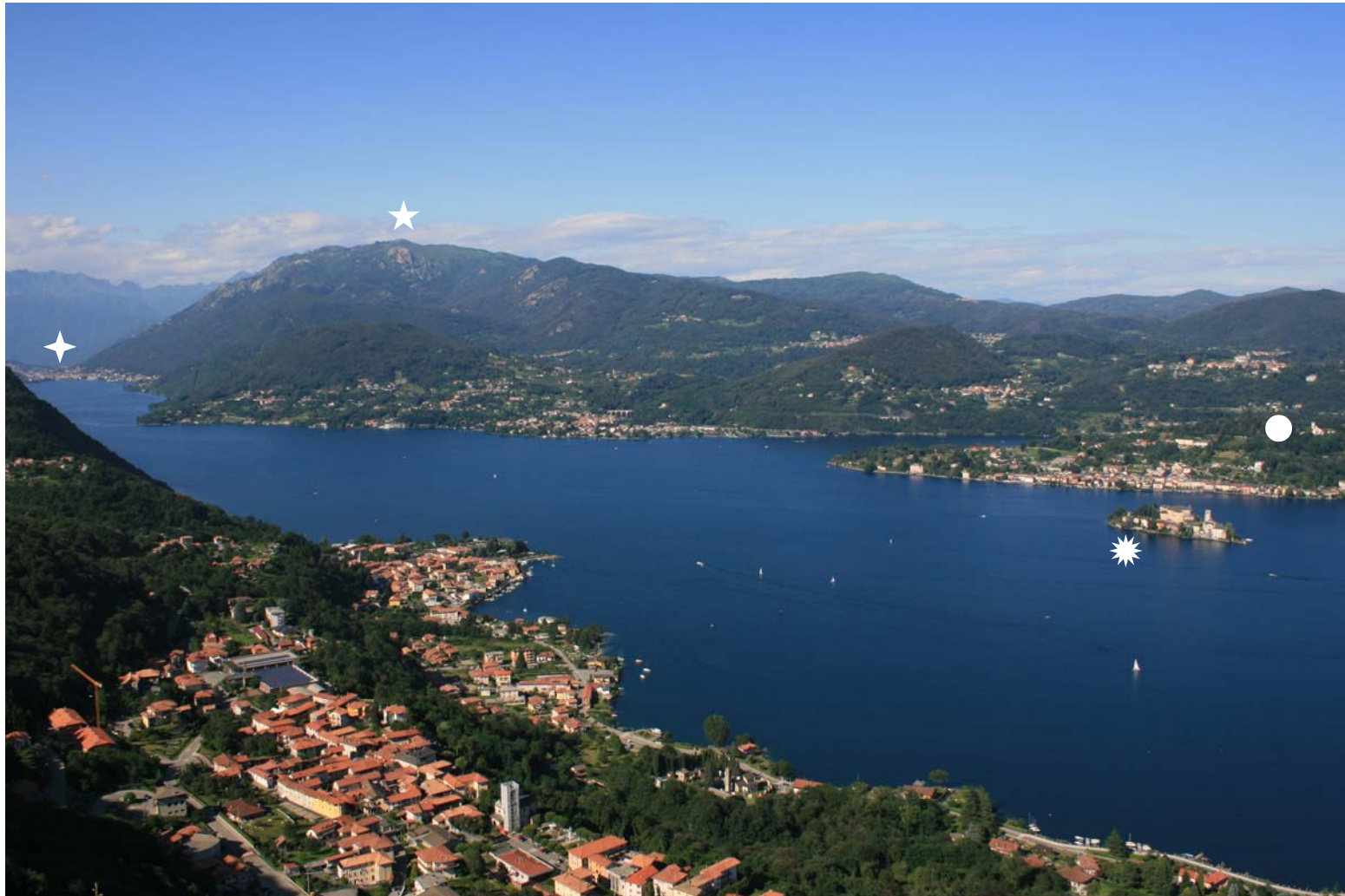
Panoramica dal Santuario della Madonna del Sasso sul Lago d'Orta ( * Isola di S.Giulio - ● Sacro Monte di Orta - ◆ Omegna - ★ Cima del Mottarone)