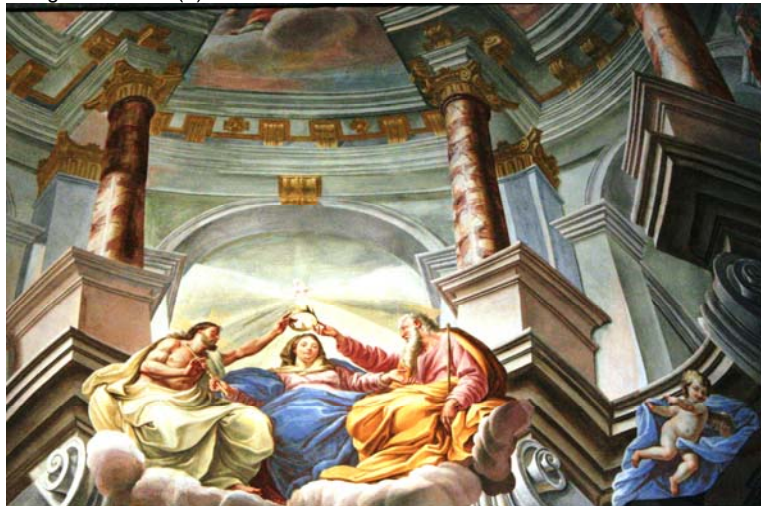
Particolare dell'interno - struttura edificata all'inizio del XVIII secolo