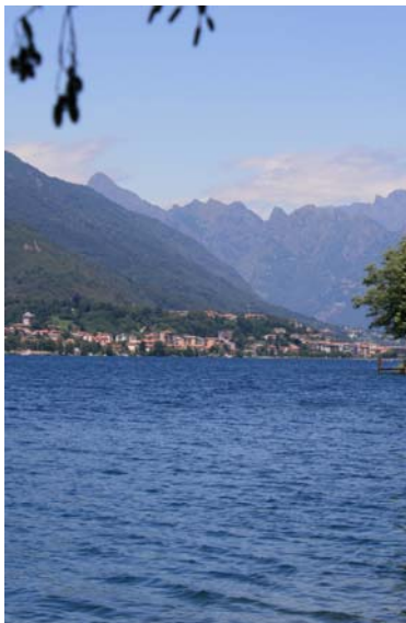
La costa verso la cittadina di Omegna