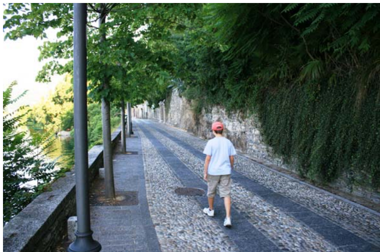
Cartina zona lago: http://www.cralgalliera.altervista.org/CartinaOrta.jpg