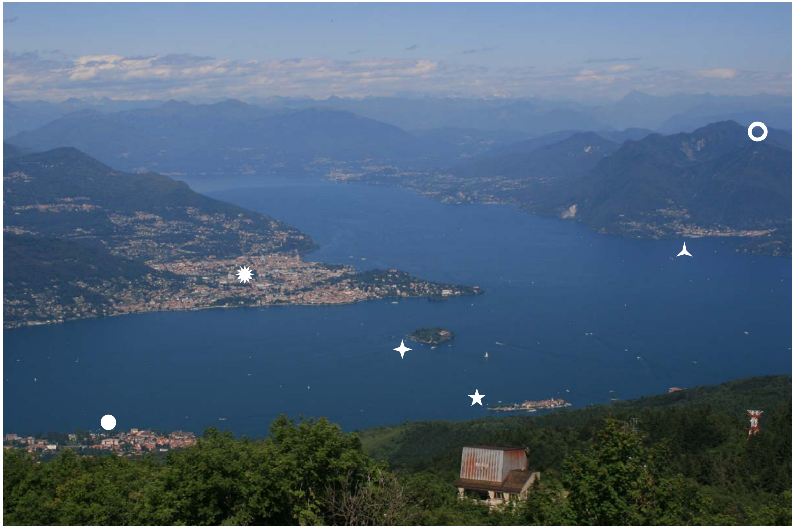
Lago Maggiore dalla vetta del Mottarone (☀ Verbania - ● Baveno - ✦ Isola Madre - ★ Isola dei Pescatori - ▲ Laveno - ○ Sasso del Ferro (in seggiovia)) Altre foto di una gita sul Lago Maggiore e le Isole Borromeo: http://digilander.libero.it/cralgalliera/borromeo07.pdf

http://www.cralgalliera.altervista.org/CartinaLagoOrta.jpg