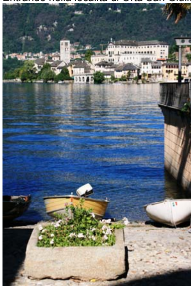
Scorcio sul lago