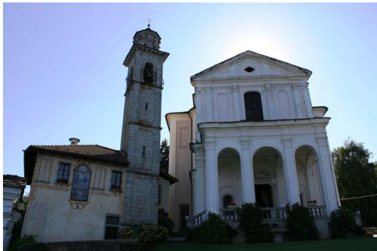
Poi, in auto, ci si sposta fino al Santuario della Madonna del Sasso sul lago d'Orta