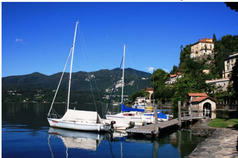
Entrando nella località di Orta San Giulio (il centro è pedonalizzato)