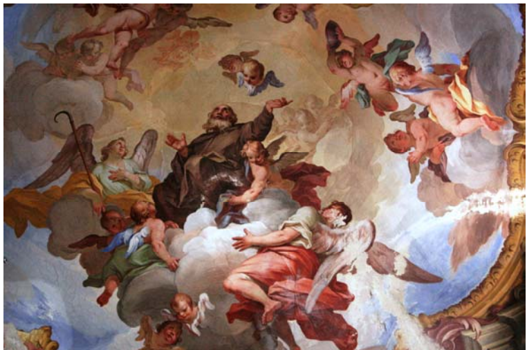
Particolare soffitto Basilica di San Giulio (stile romanico a 3 navate con abside)