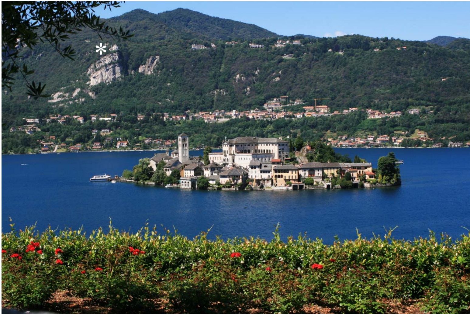
Splendida vista sul lago di S. Giulio dal Sacro Monte di Orta