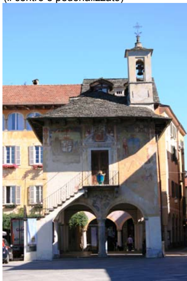
Palazzo della Comunità (1582) dove si amministrava la giustizia