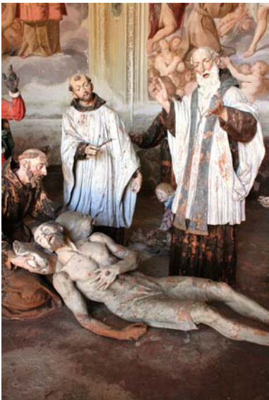
La morte di S. Francesco