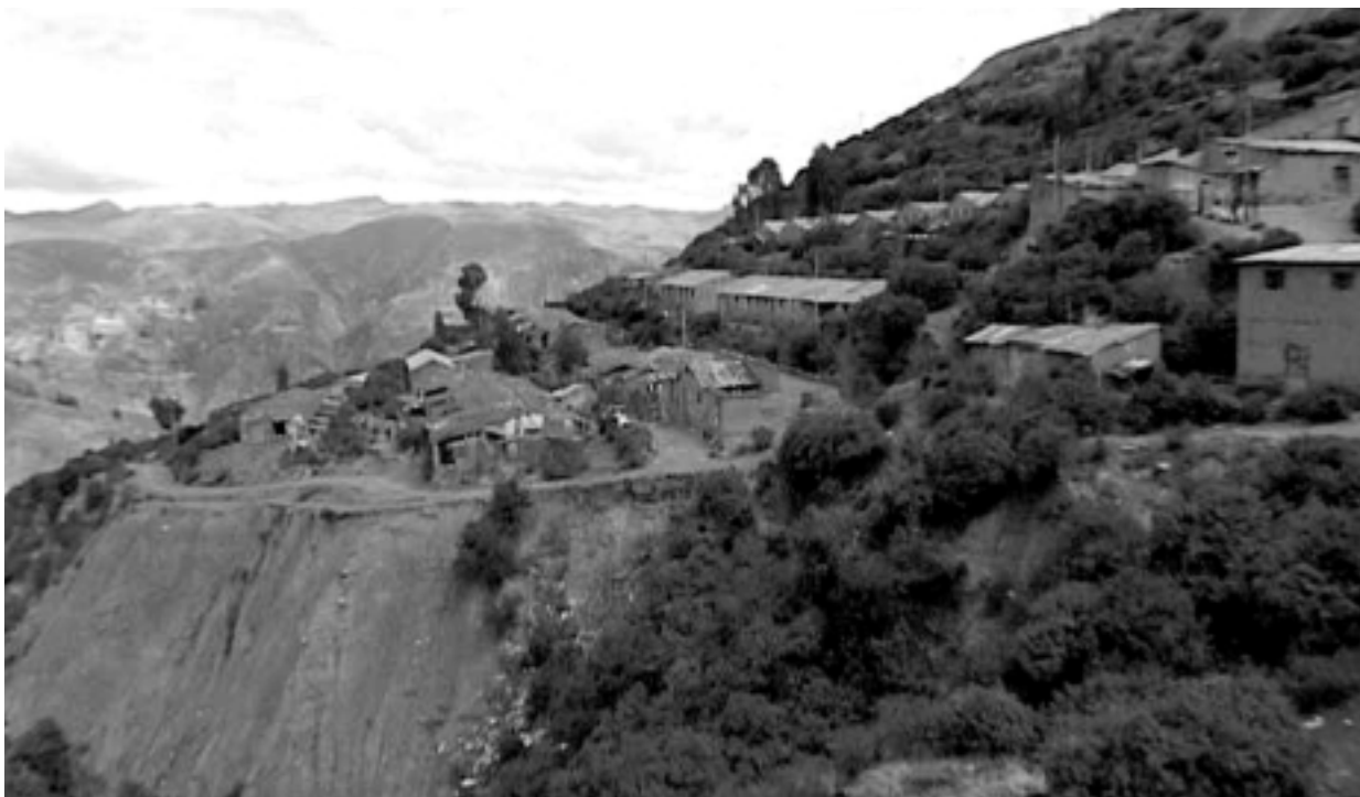
Visione di Kami, baracche sull'orlo di precipizi.