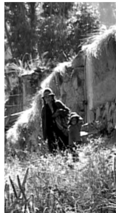
Mamma e bambino di Kami.