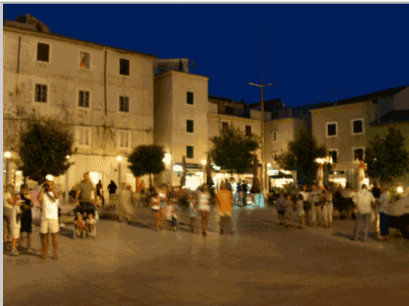
La piazza di Pag di sera, ricca di vita e con tanti ristoranti ed altri locali.