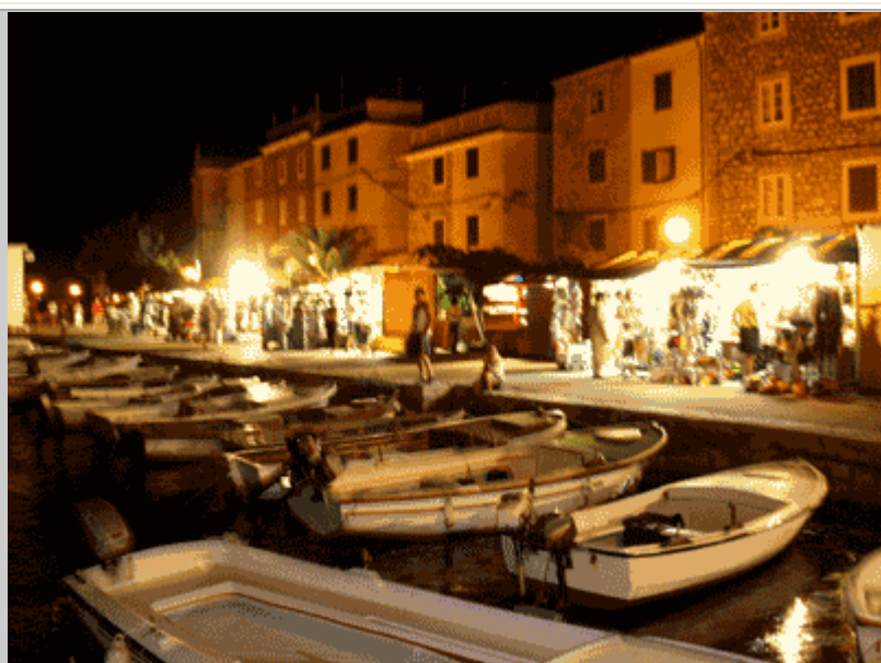
Il mercatino serale dell'artigianato sulla banchina del porto.