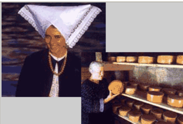
Costume di Pag.