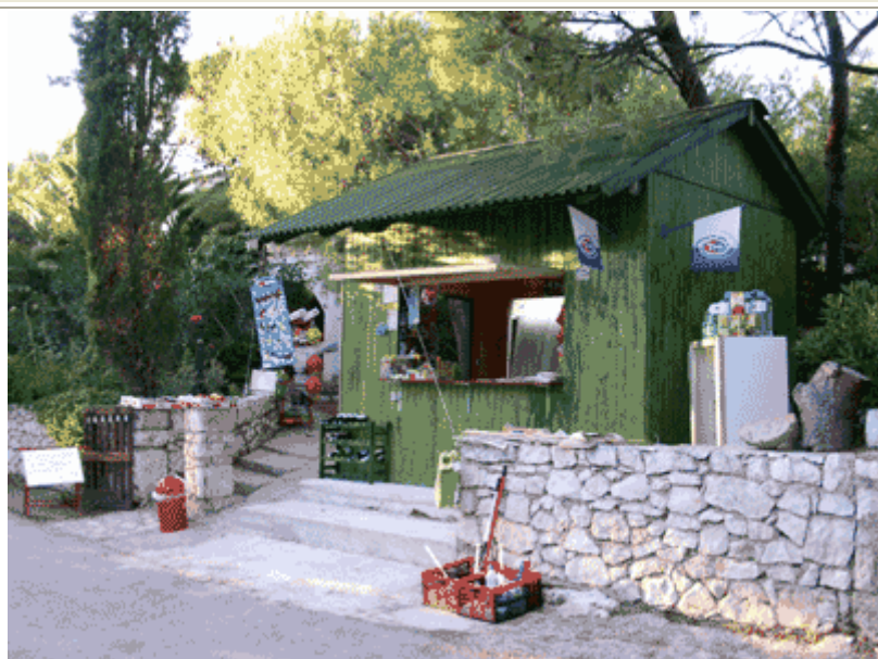
Un negozietto con tutto o quasi a Kosljun