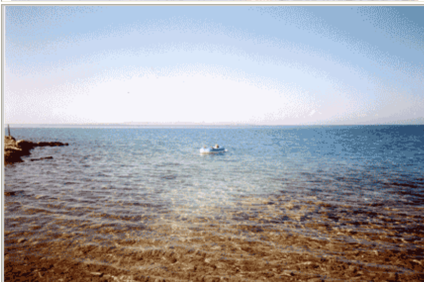
Relax nella baia