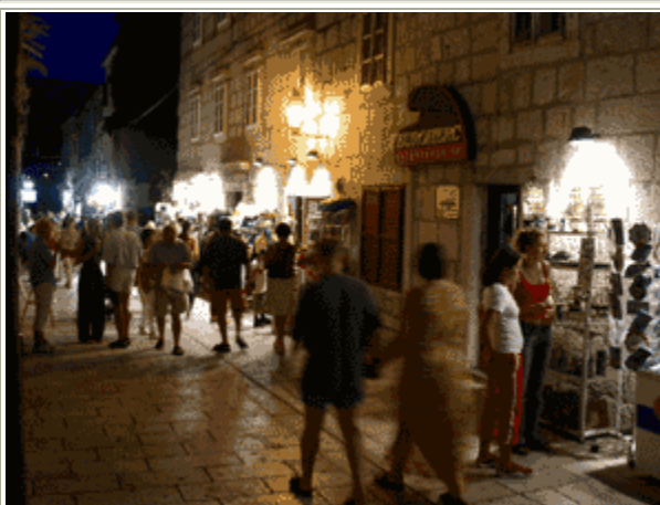
A sinistra: spiaggia di Pag.