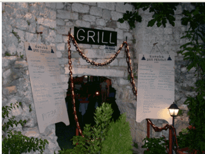
Un caratteristico ristorante nelle antiche mura della città: specialità pesce e grigliate miste.