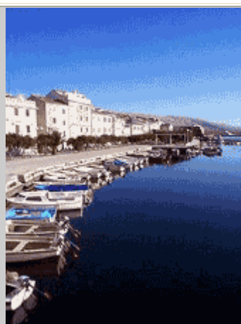
Il porto della città di Pag.