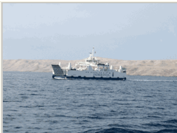
Il ferry che attracca a nord dell'isola.