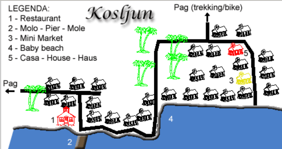
Mappa del villaggio