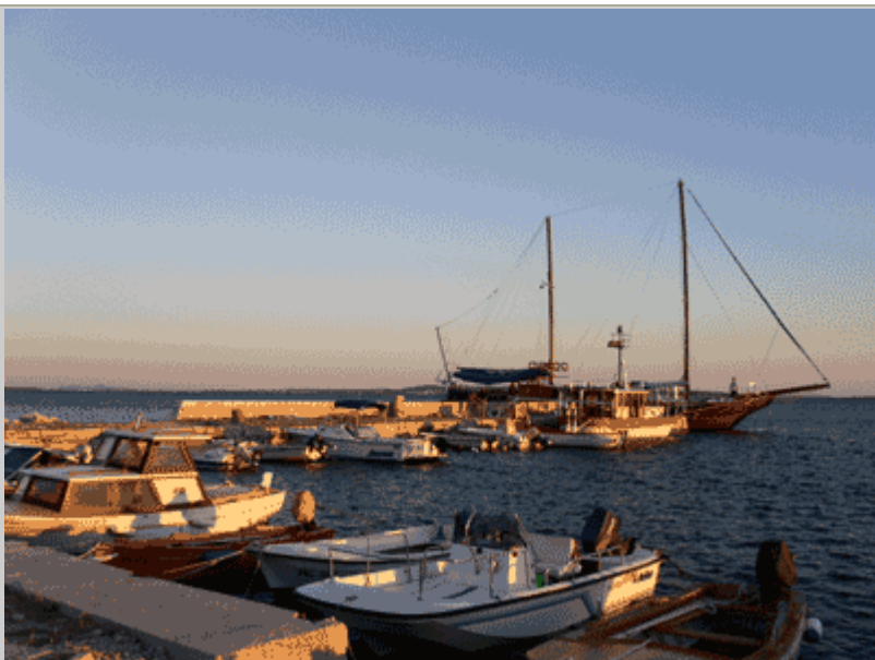
Il porto al tramonto