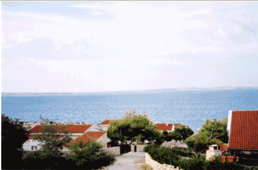
Il mare visto da Kosljun