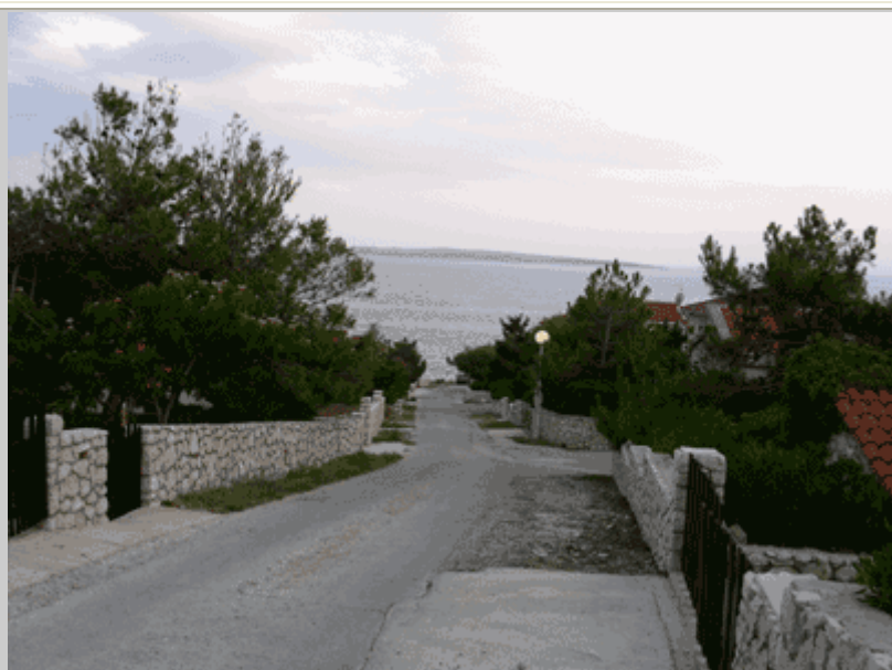
Una tranquilla via di Kosljun