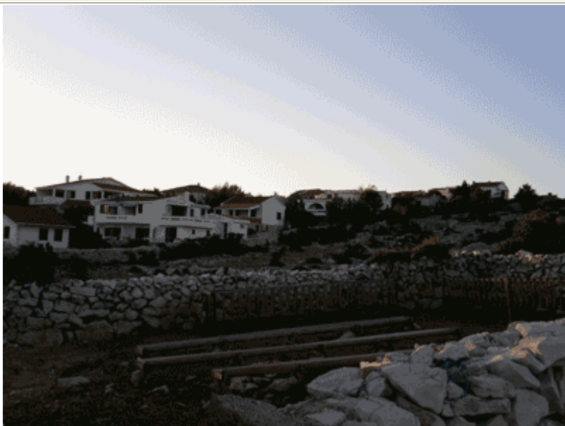
Il villaggio al tramonto